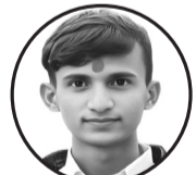
लेखक : नवल प्रसाद यादव ठेगाना : सख्खा प्रसौनी गाउँपालिका, पर्सा

धानको बालीले, सुगन्धित बनाउँछ, मधेसको माटो, सुनमा परिणत गर्छ। गहुँ र मकै, हराभरा छ सधैं, पसिनाको मुल्यले, जीवन हाँस्छ यहाँ। सौभक्तको समयमा, खेतमा भुल्किन्छ, सुनौलो घाम, जसले प्रकृति सुहाउँछ। मधेसका मानिस, सरल र भिजासिला, खेतमा पसिना, स्वाभिमानका धारा। पिउने पानी, मिठास बोकेको, खोलाको धार, गुनासो भुलेको। जताततै हरियाली, सुगन्धको बास, मधेसको माटो, सबैको विश्वास। तरकारी, फलफूल, जो सप्रेम यहाँ, मिठास लिएर, सारा जहाँ फुछ जहाँ। जमिनले फलेको, सस्तो होइन, मजदूरीको पसिना, यो साँचो अमूल्य हो। गाउँका केटाकेटी, रमाउँछन् खेतमा, जतासुकै देखिन्छ, उमंग र खुशीका सपना। मधेसको खेतबारी, जीवनको सार, माटोमा लुकेको, सभ्यता साकार। गाउँका मान्छे, जीवन सँग लड्छन्, उपजको रोटीले, सारा दुःख हट्छन्। मधेसको खेतबारी, गर्व गर्ने ठाउँ, प्रकृतिको वरदान, यहाँ छ हाम्रो गाउँ।