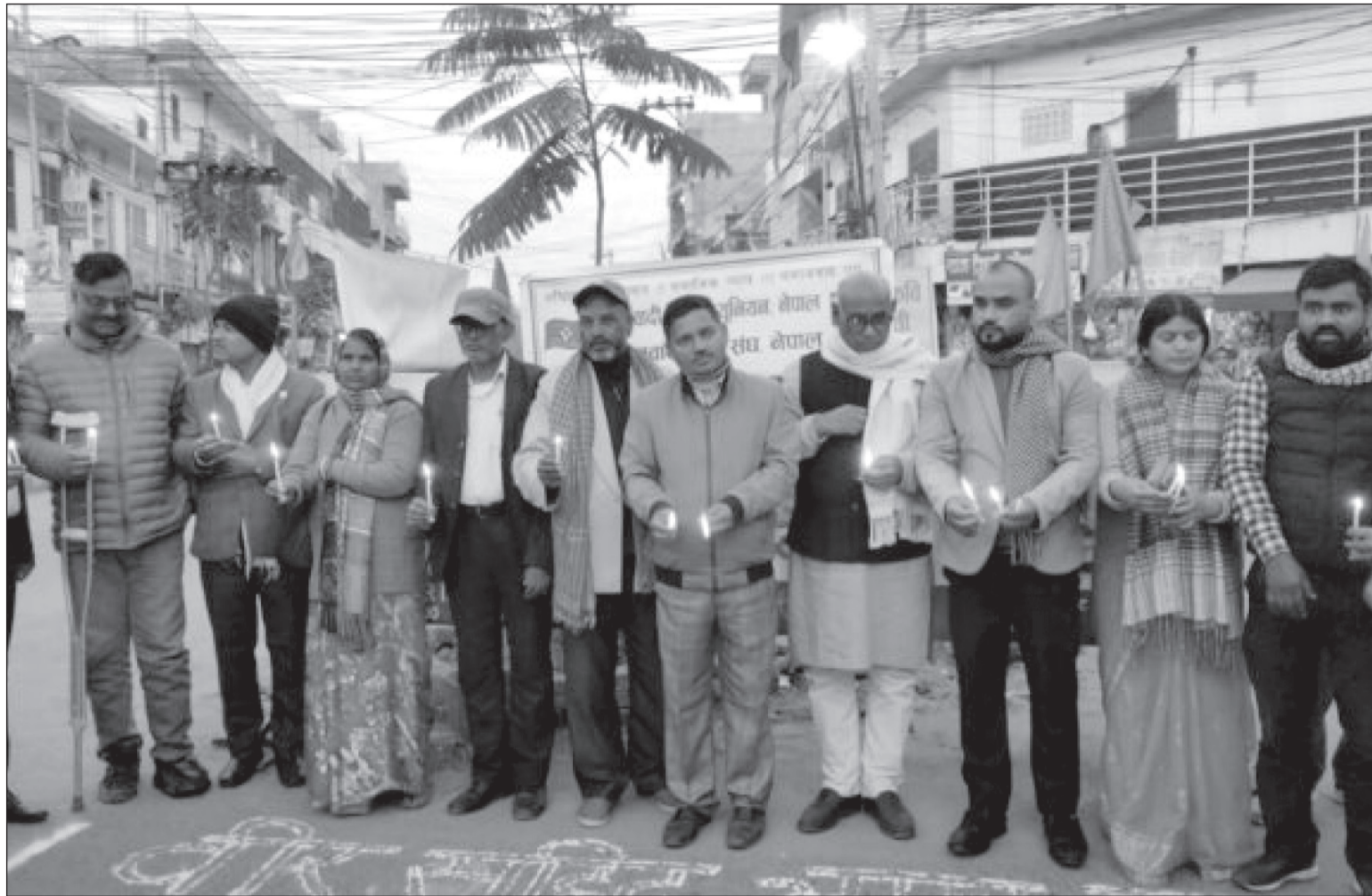
बलिदानी दिवसको अवसरमा जसपा नेपालले जनकपुरधामको भानुचोकमा मोमबती बालेर शहिदहरुप्रति श्रद्धाञ्जली अर्पण गरेका छन् ।