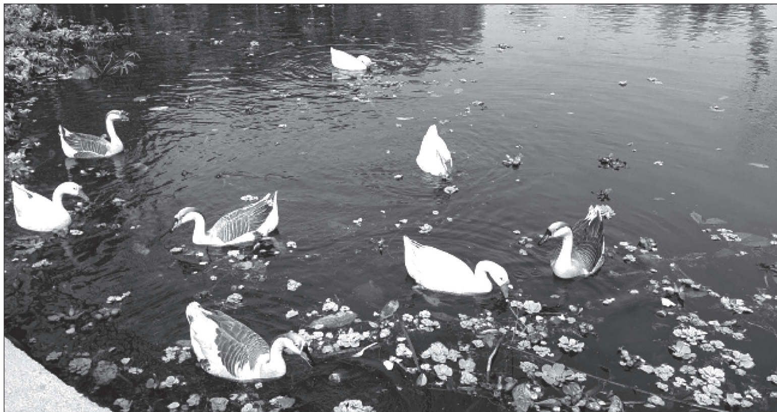
मोरङको बेलवारी नगरपालिकास्थित बेतना सिमसारमा जलक्रीडामा रमाउँदै गरेका होंसका बथान ।