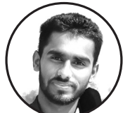
लेखक: उदय प्रसाद

समयलाई पखैर नबन्नु समयले तोड्छ विश्वास। गर्नु छ नयाँ गर्नु पखैर नबन्नु। इतिहास लाई सम्झनु बनाएको बाटोमा सब हिडछ। नयाँ बाटोको खोजी गर्नु जब सम्म लक्ष्य पाउँदैन तब सम्म खोजी गर्नु। साथी भाई आउँदै जाँदै गर्दा पखैर नबन्नु। सूर्यको प्रकाश भै । लक्ष्यको गति राखनु। कमिला भै लक्ष्य राखनु। हार मानिन कहिलो। दुःख आए पिडा आए पखैर नबन्नु । आफ्नो लक्ष्य जारी राखनु। पछि कहिले नहटनु। समय लाई दियो निरन्तरता। समयमै हुन्छ सफलता।