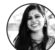
लेखक रिमता मण

साथमा आमा न हुदा त धाम पनि कालो लाग्छ। आमा साधारण मान्छे को रूप मा भगवान लाग्छ। आमा बिना संसार को सबै खुसी अथुरो लाग्छ। मात्र आमा हुदा कोहि न हुदा पनि जिन्दगी पुरो लाग्छ। म भन्छु आमा भगवान भन्दा ठुलो त होइना। तर आमा भगवान भन्दा सानो पनि होइना।