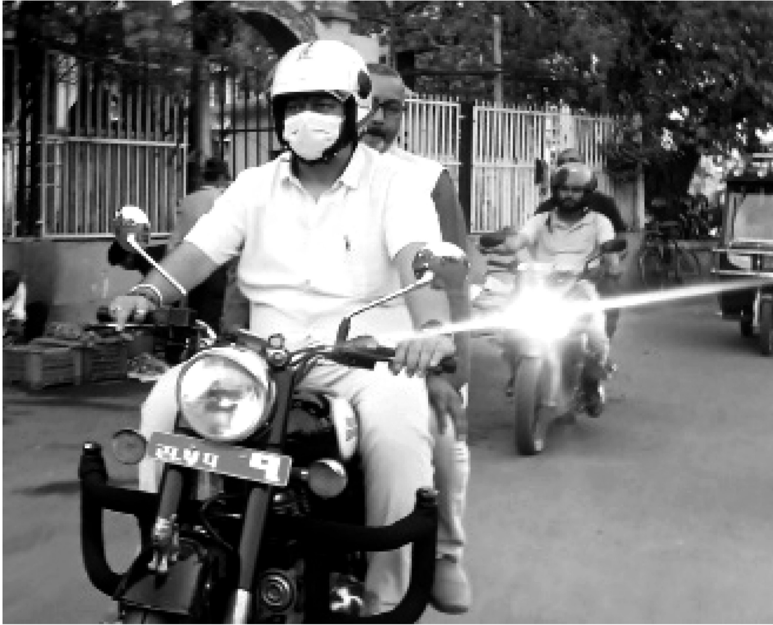
मुख्यमन्त्रीको स्टन्ट : अस्पताल अनुगमनको अपार सफलता पछि मधेश प्रदेशका मुख्यमन्त्री सतिश कुमार सिंह मोटरसाईकलमा बसेर होटल अनुगमनमा ।