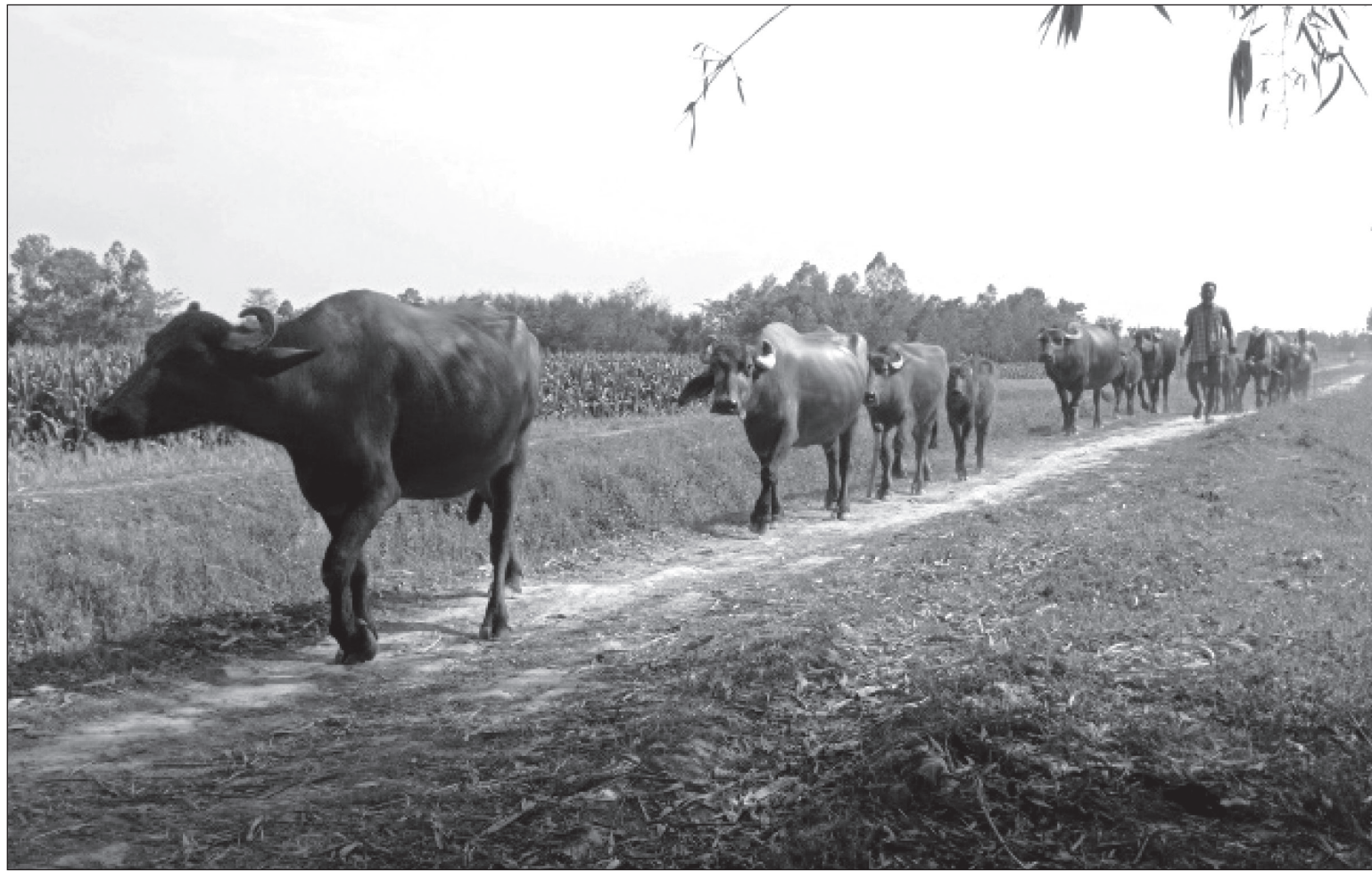
भैसी चराउन हिँडेका स्थानीय गोठाला। पशुपालन स्थानीय यदुवंशी यादव समुदायको पुख्र्यौली पेशा हो।