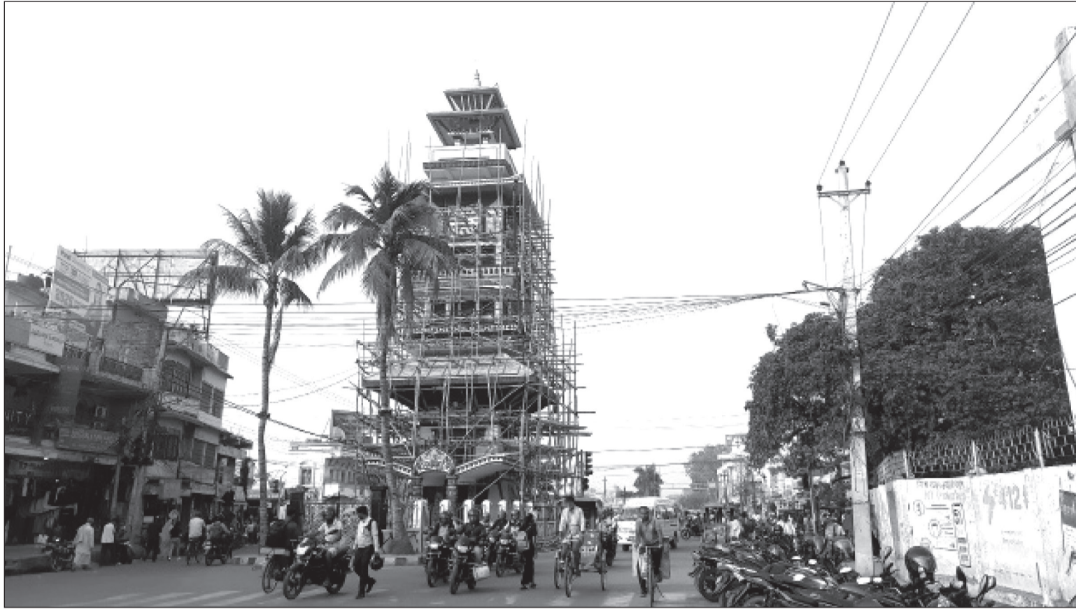
वीरगञ्जस्थित घण्टाघर मर्मतसम्भारको लागि बाधिएको खट। एक महिनाअघि घण्टाघरको केही भाग चर्किपछि वीरगञ्ज महानगरले आवश्यक मर्मतसम्भारको काम अघि बढाएको हो।