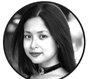
लेखक: रशमी दनुवार मोरङ, नेपाल

आर्थ खोज्दै दौडिन्छ मान्छे, दुःख, पसिना बगाइ दिनरात, शुपाउँ पैसा, घर र गाडी, तर मन खाली, खै सन्तोष साथ? आर्थले किन्छ सुविधाहरू, किन्छ ऐशआरामका क्षण, तर बेचन सक्दैन त्यो हाँसो, नैसर्गिक माया, न आत्मा सन्तोष। थोरैमा खुसी हुन छोड्दा, लोभको आगोमा जल्छ जीवन, अर्कालाई कुल्ची अघि बढ्नेहरू, सकिन्छ आर्ष, रहन्छ शून्य सपना। सम्पत्ति भए पनि शान्ति छैन, मन भित्र त्रास र भय, आर्थले त सुख दिन सक्छ, तर आनन्द दिन सक्दैन कहिल्यै। त्यसैले आर्थ कमाउ तर, मनको सन्तुलन नगुमाउ, सच्चा धन त माया हो, यो सत्य कहिल्यै नबिर्स जाऊ।