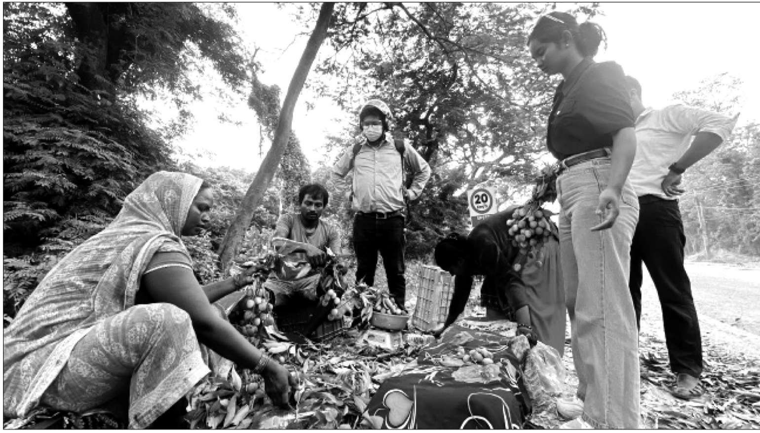
पूर्व-पश्चिम राजमार्ग अन्तर्गत सर्लाहीको लालबन्दी नगरपालिकामा पर्ने उष्ण प्रदेशीय बागवानी केन्द्र नवलपुर अगाडी राजमार्ग किनारमा व्यापारीसँग लिची खरीदे गर्दै ग्राहक।