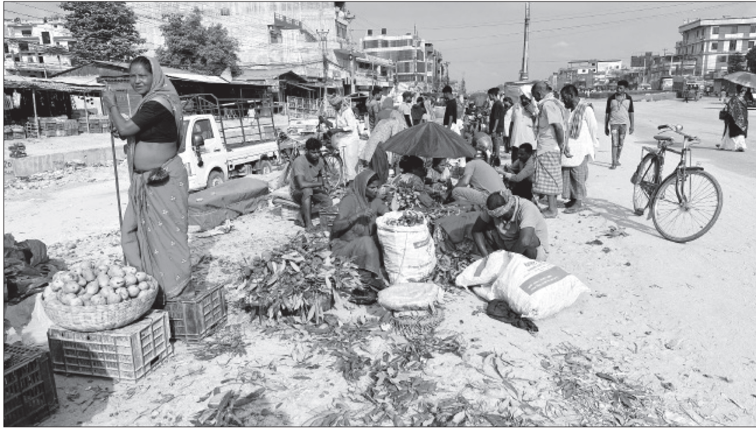
सिरहाको लहानमा पूर्व-पश्चिम सडक किनारामा स्थानीय कृषकले उत्पादन गरेका आँप, लिचिलगायतका फलफूल किनबेच गरिँदै ।