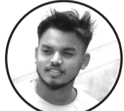
लेखक: दिलीप कुमार दास ठेगाना: धनुषाधाम-४ लक्ष्मीपुर

देशको छ चिन्ता, मन भित्र पोल्दछ, नेताले बाचा, तर काममा गोल्छ शिक्षा बिना युवा विदेश पलायन, घर खाली, आँखा भिज्छन् अविरामा हिउँ भँ पैलिनछ सधैँ हाम्रो सपना, विकासको नाउँमा देखिन्छ धमना आशा बोकी हिँड्छन् बुढा आमाबाबु, सन्तान विदेश, रिक्तो छ थालीमा खाजु खेतमा माटो, तर मल छैन हातमा, जनता कराउँछन् सुनुवाइ बातमा घुस बिना जागिर, सपना जस्तै लाग्छ, इमानदारी अब भुटोमा साग्छ देशको छ चिन्ता, निद्रा हरायो यति, के होला भोलि, कसरी लेख्ने गाथा बिती? तर अर्भै विश्वास छ यो मुटुमा भारी, आउँछ एक दिन, देश बन्छ उज्याली