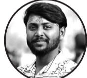
लेखक: बबु शर्मा ज. उ. न. पा.-७

शुभ घडी आयो, बाजा बज्यो, दुलहीको मुहारमा उज्यालो भर्कियो पिउसो लिएर वर आयो हाँसी, दाइजोमा आयो बुल्लेटको सवारी बुल्लेटको आवाज जस्तै, जोश भरिएको, घर-आँगन रमायो, मन खुसीले भरिएको छोरीको बिदाईमा आँसु पनि थियो, तर बुल्लेट हेरेर बाबुको मन ढुक्क थियो "छोरी सुखी रहोस्," आशिष दिइयो, बुल्लेटसँगै जिन्दगी रमाइलो होस् भनियो न त माग गरिएको, न त जोरजबर, सहमतिमा पाएको त्यो उपहार, सबैको रहरा सहरका गल्लीहरूमा बुल्लेट गुनुनायो, दुलहीको सिन्दुरले त्यो यात्रामा चमक थपायो दाइजोको कुरा गरौँ अब परिवर्तनको सुरमा, माया, सम्मान, र सहमति होस्, हरेक कुरामा बुल्लेट त केवल एउटा खुसीको माध्यम, साच्चैको सम्पत्ति त सम्बन्धको साँचो गहना दाइजो होस् उत्सवको रंग, न कि दबाबको बोभ, जहाँ खुशी बाँडिन्छ, त्यहाँ प्रेम प्रेम हो जोसा