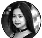
लेखक: रशमी दनुवार मोरङ्ग, नेपाल

हए गर्मी तिमि किन यति कठोर? घाम तिमिले भन्ने बनायो कठोरा भलमल घामले पोल्छ छाला, घामसँग लडनू पन्यो साला! पंखा घुम्छ तर शीतल हावा छैन, ए.सि.को सपना, बिजुली कहाँ छ र तै? घाँटी सुक्छ, घाममा पसिना भर्छ, तैपनि काम रोकिँदैन, जिन्दगी अर्भै कछी चिसो पानी, चिसो भोल लाजे लादैन, गोलभेंडा, कीक्री, तरबूजा स्वादे मिठो छ हैन? तर तिमिले लुकायो भरनाको गीत, सडकमा तातो तुवालो, छायाँ बिना रीता बालबालिकाले भनुनु, "स्कूल जान मन छैन!" बुढाबुढीले भनुनु, "यो उमेरमा त भन्न सहेना" न त पानी पर्छ, न त हावा बहन्छ, हए गर्मी तिमि साँच्चिकै निर्दयी बन्छ तर थाहा छ, तिमि पनि जान्छौ एकदिन, भरीको मधुर संगीतमा, आउनेछ शीतल छिन् । अनि हामी भन्छौँ हाँसी- "हए गर्मी! फेरी भेटौँला, अब बिदा दे है, आशी!"