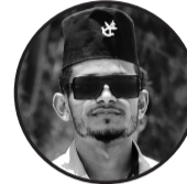
लेखक मो. अमिर हुसैन ठेगाना जनकपुर १५ लोहना हाल काठमाडौं जोरपाटी

शब्द नबोली बोल्छ माया, नयनले लेख्छ कथा सारा धडकन भित्र गुञ्जिन्छ उसको नाम, साँभ-साँभमा आउँछ उसैको काम। उ उसको थिएँ, ऊ मेरो थिएन, तर माया त साँचो, भुटो के नै हुन थाल्यो र? मुस्कान भित्र लुकेको पीडा, अधुरा सपना र भिजेको चिडीको रीता भेट त थोरै भयो जीवनमा, तर सम्भ्रनाले साथ दियो प्रत्येक पलमा। मायाको कुनै सीमा हुन, दूरीले होइन, आत्माते नाता छुट्टैना आज पनि त्यो बाटो चुपचाप बोल्छ, जहाँ हामी एउटै छायाँजस्तै हिँड्थ्यौं। माया अझै बाँकी छ हृदयको कुनामा, मौन भएर, गहिरिएर... उसैको नाममा।