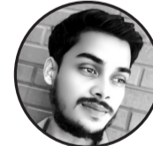
रचना-रमेश मंडल धानुक मुतही पटेवा, धनुषा, नेपाल, मधेश प्रदेश

कतै युवालाई नै भोले देखेछु कतै युवालाई नै बोले देखेछु फटफटी अवाज चप्पलको कतै युवालाई नै डोले देखेछु युवाले नै सल्काएको आगोबाट कतै युवालाई नै पोले देखेछु गोप्य राखेका हरेक योजनालाई कतै युवालाई नै खोले देखेछु फटफटी अवाज चप्पलको कतै युवालाई नै डोले देखेछु बाँधिएका हात टाँसिएको ओठ कतै युवालाई नै छोले देखेछु साथमा दयाँ बयाँ हात हिँडेको कतै युवालाई नै सोले देखेछु फटफटी अवाज चप्पलको कतै युवालाई नै डोले देखेछु