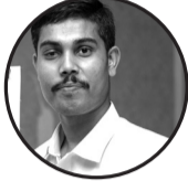
आभाण कर्ण जनकपुरधाम:-१४ ( बसहिया)

सिखबैछी हम पढबैछी हम भलमनतिके पाठ मर्यादाके मान मनोनिता ईमानक देखी साथ साच बातके अचिया चढाक पजारी पथ प्रकाश चसकल बगुला नजर गरीने पोठाके केने आसा।१॥ पारदर्शीके पर्दा पाछु छै मिलो मतो खेल चोर चोर मस्यौते भाई एक आपसमे मेल। शासन प्रसासन पैसा पावर चापलुसीके बल नै किछ जानी नै किछ बुझी हमहिटाछी भला।२॥ आभूषण बेचक ईमानके लाजनिता नाच नचनेछी भ्रष्टे भ्रष्टके बस्तिमे नैतिकताके ज्ञान रचनेछी। जानलो बुझल बाते सभटा खा पी पचौनेछी नैतिक ईमान ज्ञान नै कनिको ethics आहा सिखौनेछी।३॥