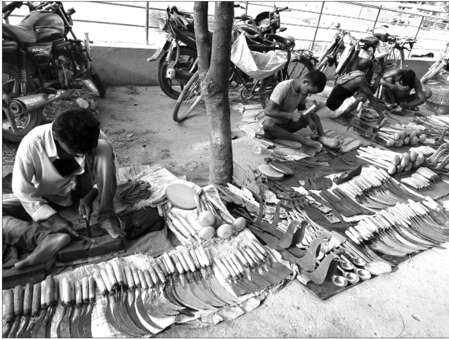
महोत्तरी जिल्लाको सदरमुकाम जलेश्वर नगरपालिका-१ स्थित हटियामा दैनिक प्रयोगमा आउने धरेलु हातहतियार निर्माण तथा बिक्री गरिँदै ।