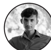
लेखक : नविल प्रसाद यादव ठेगाना : सखुवा प्रसौनी गा.पा पर्सा

जनता रोएर के पो हुन्छ, सुने कान छैन सता सँग, बाचा गर्नेहरू कुसीमा, भूटको पर्दा ओढेर सँग। पसल बन्द, रोजगारी छैन, पेट पोल्छ हरेक दिन, अधिकार लेखिन्छ पोस्टरमा, तर व्यवहारमा कहिल्यै नकिना विद्यालय टाढा, बाटो छैन, बिरामी हुँदा डर लाग्छ, पैसा बिना उपचार छैन, मुटु दुखेर पनि भाग्छ। हिजो जसले भोट माग्थो, आज तिनकै गेट छ बन्द, न त फोन उट्छ, न त खबर, जनताको शिरमा छ घाम जन्डा। सडकमा धुलो उड्छ अझै, विकास त फोटो खिचन मात्रै, न्याय भनेको शब्द भयो, न्यायाधीश पो बोल्छ कागज भित्रै। जनताको पीडा ठूलो छ तर, त्यसको तौल कसले तोल्ने? यो आँसु सरकार देख्दैन, अनि प्रश्न उज्जन्ध - जनताको पीडा साँच्चै... कस्ले बुझे?