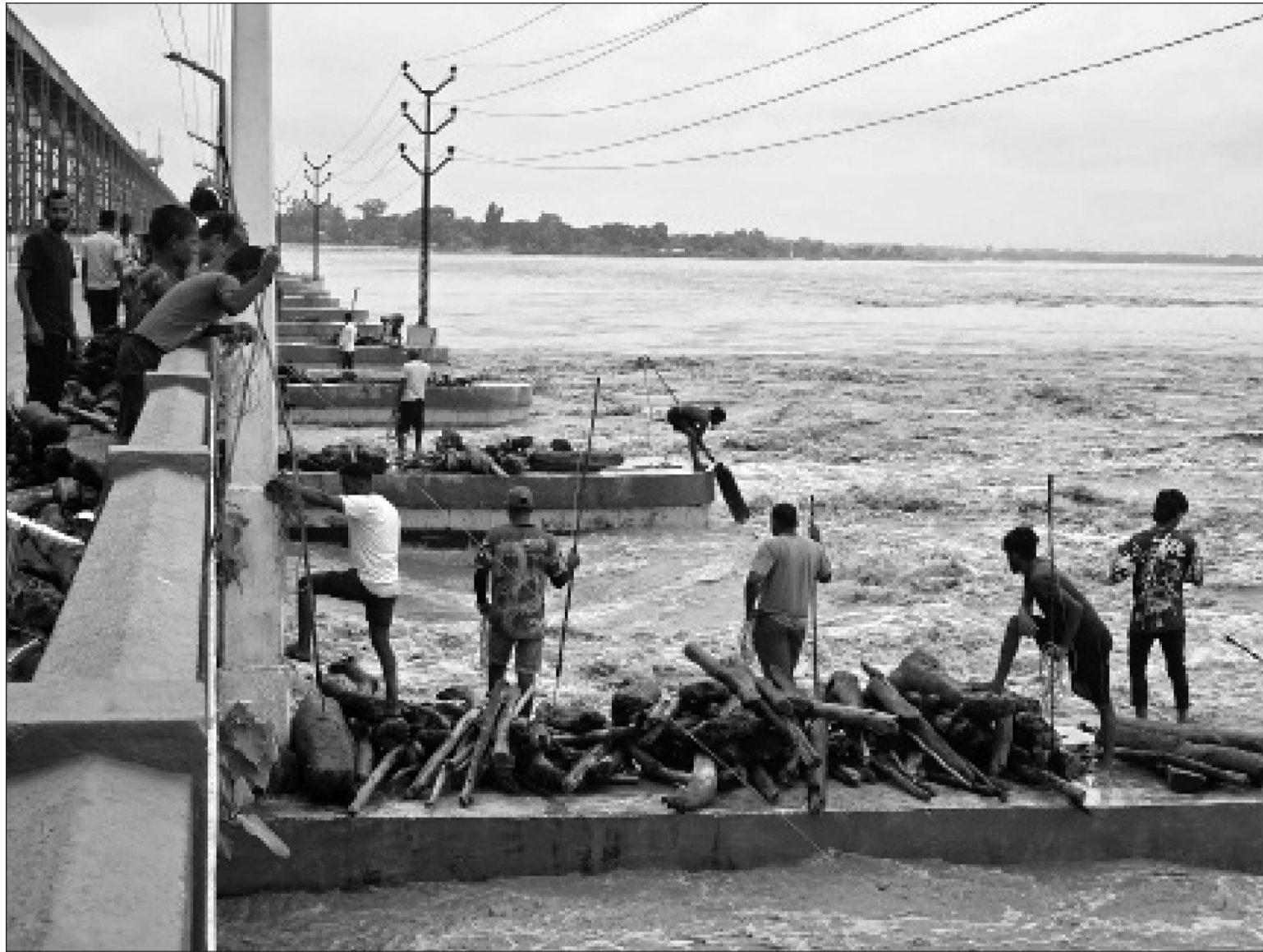
पूर्वी पहाडी जिल्लाबाट सप्तकोशीले बगाएर ल्याएको दाउरा स्थानीयहरू जोखिम मोलेर नदीबाट टिप्दै दैनिकी जीविकोपार्जन र आर्थिक स्रोतको जोहो गर्दै स्थानीय स्थानीय बासिन्दा ।