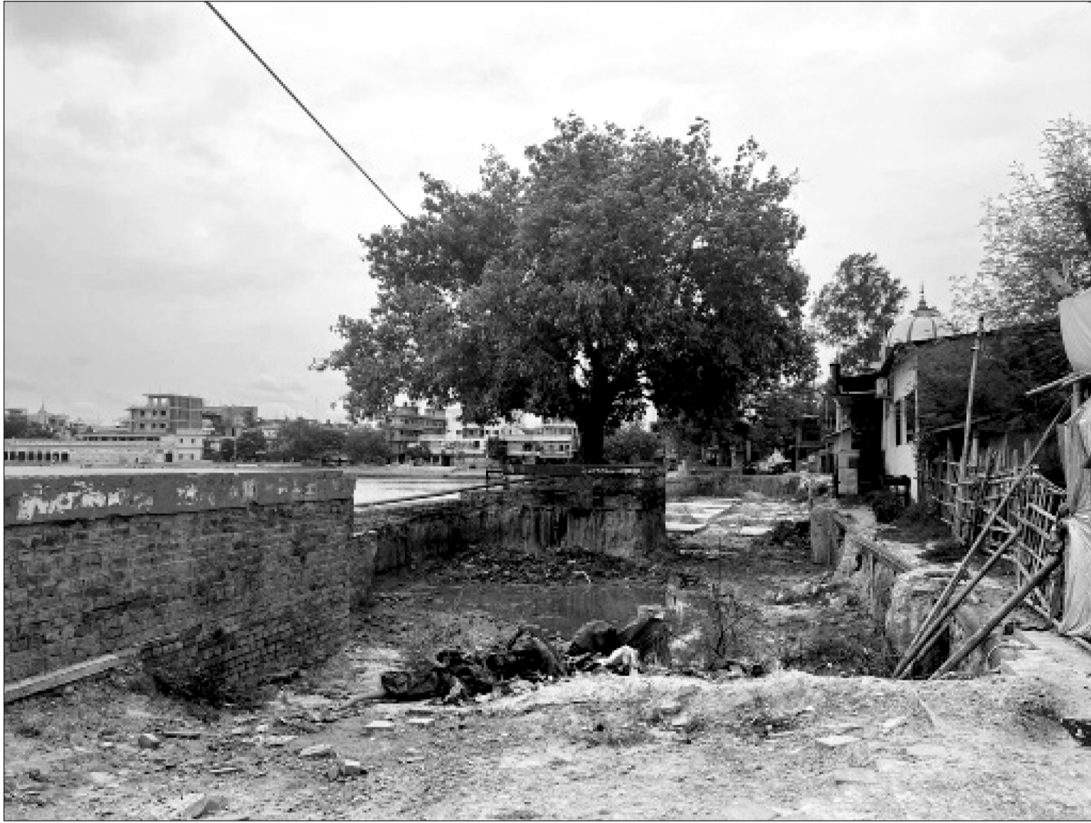
ज्यानामारा खाल्डोकोरुपमा परिणत भएको गंगासागरको डिल,अदालतले काम गर्न रोक लगाएपछि खाल्डो भर्नुको सटा त्यसै छाडेपछि गंगासागरको सुन्दरता विगारेको एकातर्फ छ भने बाटोको रुपमा प्रयोग हुदै आएको उक्त जग्गा दुर्घटना पनि हुन सक्ने समस्या बढाउदै गएको छ ।