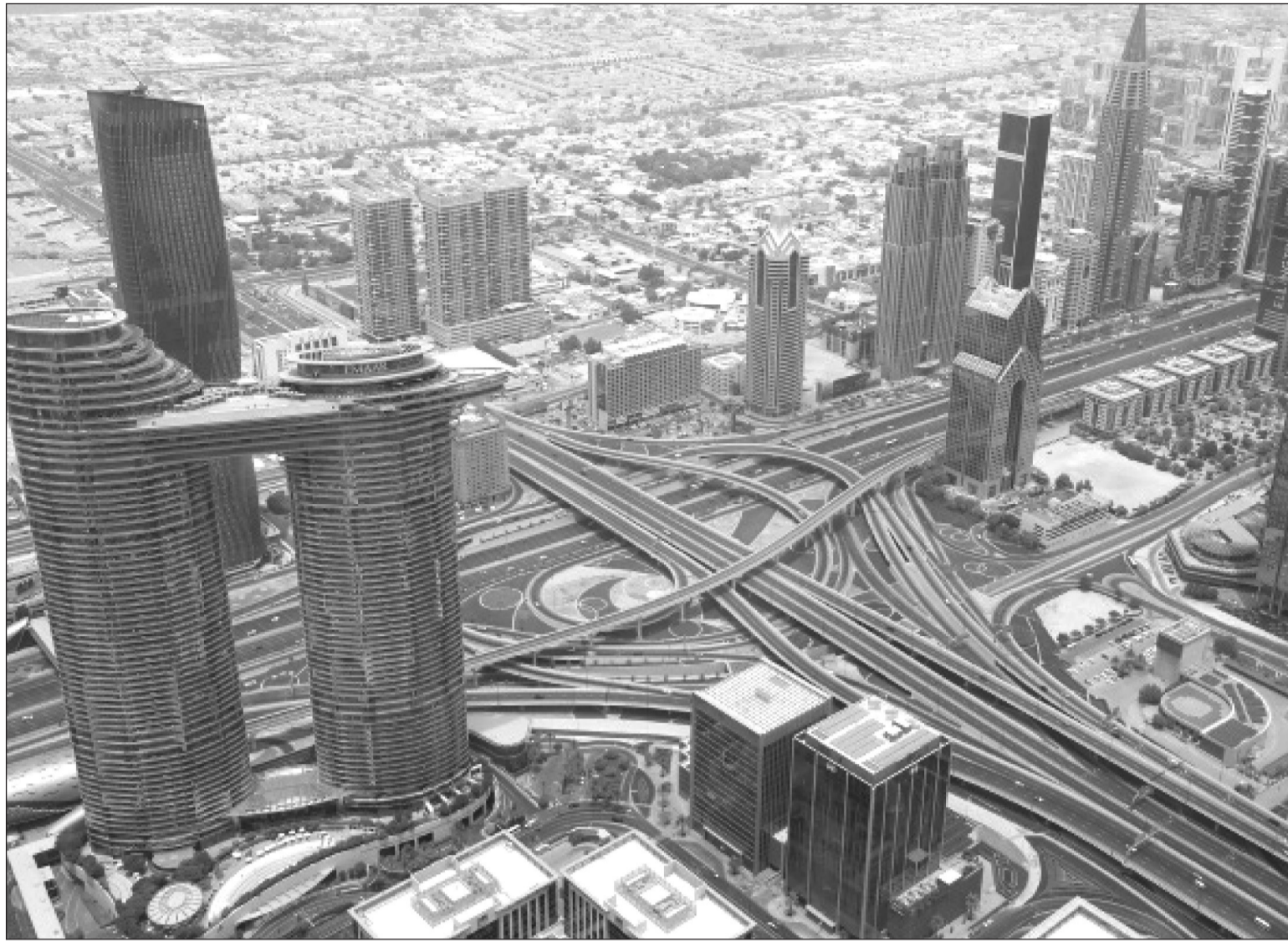
संयुक्त अरब इमिरेट (युएई) को वर दुबईमा रहेको संसारकै सबैभन्दा अग्लो टावर बुर्ज खलिफाको १२४ तल्लाबाट तल देखिएको दृश्य। वरिपरि विभिन्न टूलुला भवन तथा टावरहरू खलिफा सन् २००४ मा निर्माण सुरु गरी सन् २०१० मा निर्माण सम्पन्न गरेको टावर ८२८ मिटर अग्लो रहेको छ भने १६३ तल्ला रहेको छ।