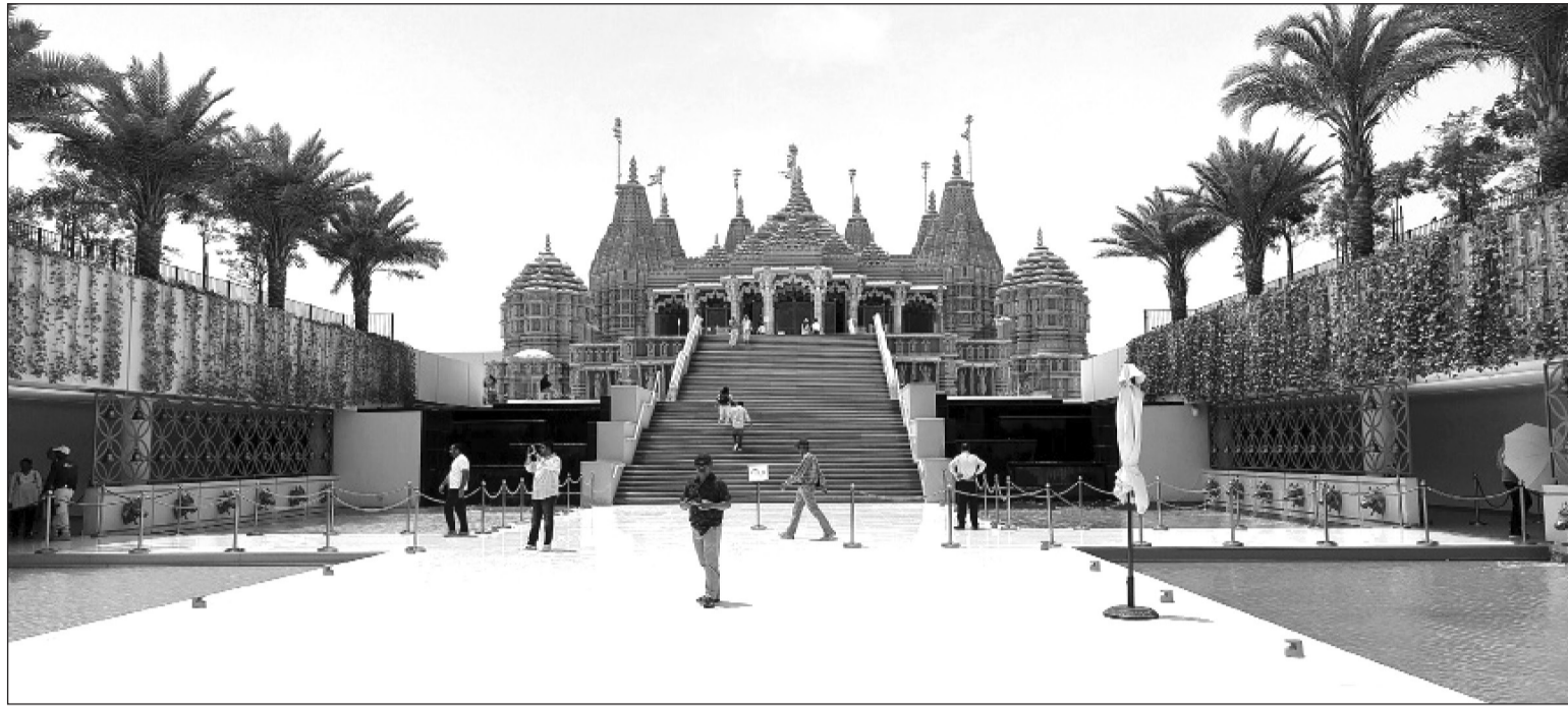
संयुक्त अरब इमिरेट (युएई) को अलुवाधामा रहेको प्रसिद्ध विष्णुस हिन्दु मन्दिर । मुस्लिम देशमा हिन्दु मन्दिरलाई सांस्कृतिक विविधता एवम् सहिष्णुताको प्रतिकको रूपमा लिने गरिन्छ ।