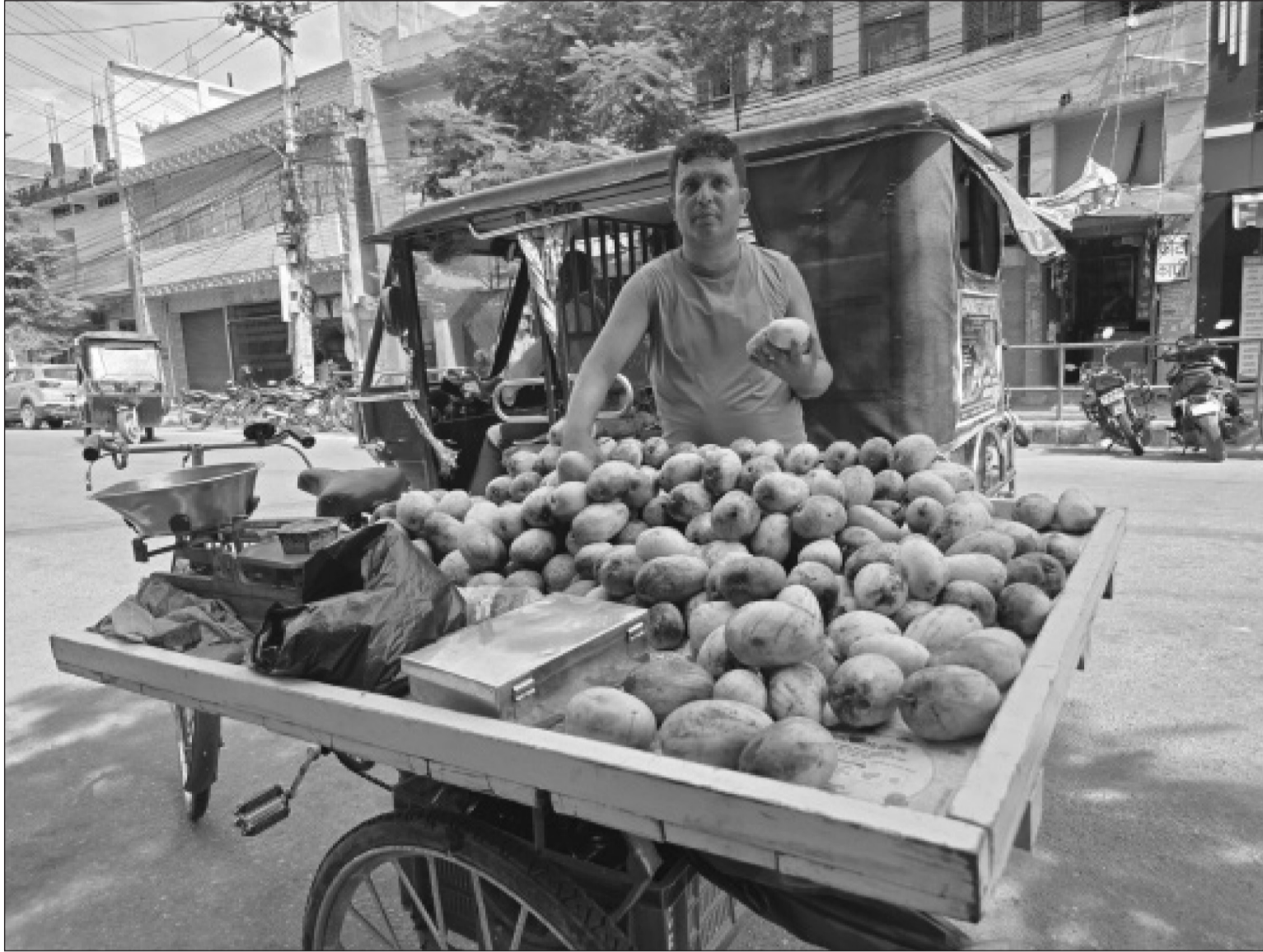
आँपको सिजन समाप्तीको समयमा निकै नै महगोमा आँप विक्री वितरण हुँदै आए पनि चाडपर्वको लक्षित ठेलागा आँप बेच्ने एक व्यवसायी ।