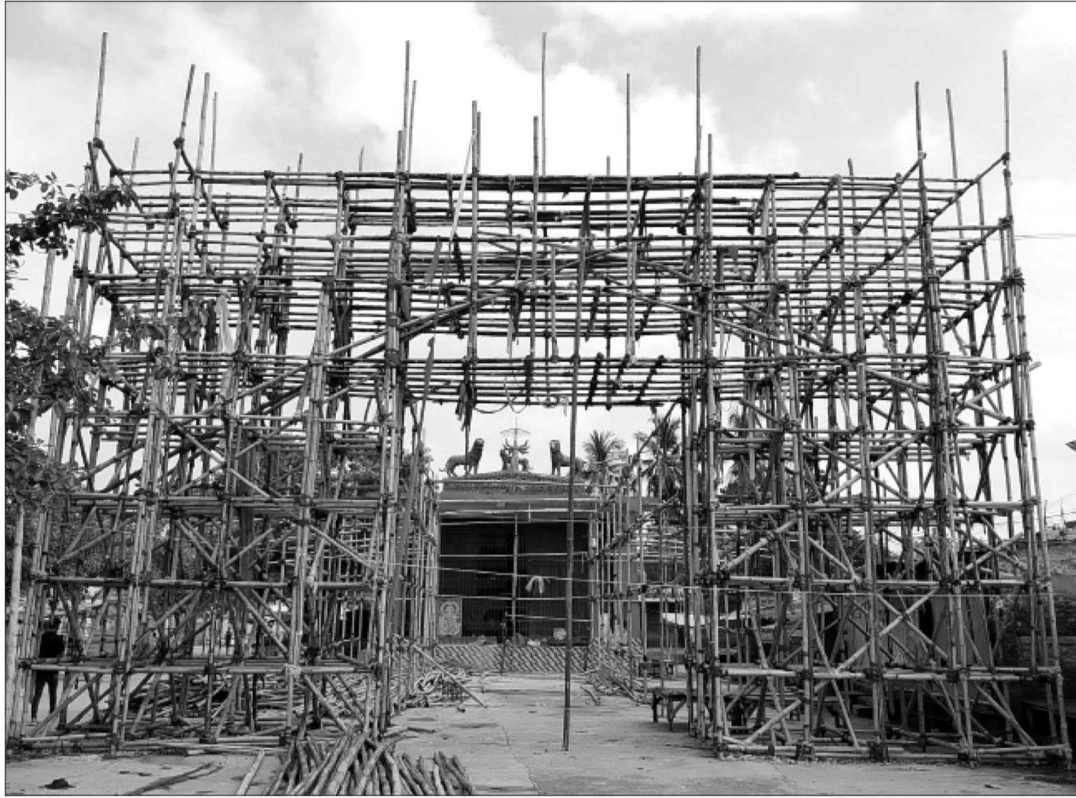
महोत्तरीको सदरमुकाम जलेश्वर नगरपालिका-१ मा दुर्गा पूजाका लागि मन्दिर निर्माण गरिँदै ।