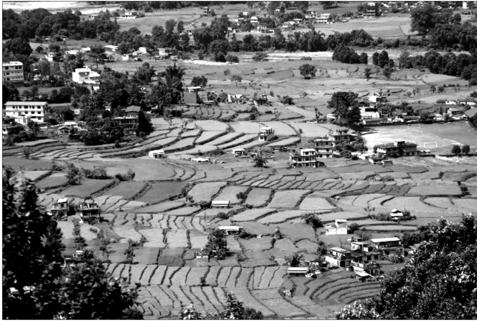
मध्यनेपाल नगरपालिका- ६ काउरेको ज्वाला आधारभूत स्कुल परिसरबाट देखिएको भोर्लेटार फाँटको धानखेती, ईशानेश्वर क्याम्पसको खेलमैदान र आसपासका क्षेत्र ।