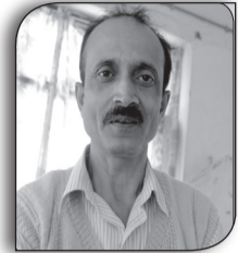
प्रभाषचन्द्र मा त्रिभुवन पत्रकार

जेन-जी नामक हुरीमा केपि ओलीको सत्ता उड्यो । सो हुरीको प्रबल वेगलाई निश्चल बन्न दिएको भए, विध्वंस मच्चिने सम्भावना न्यून हुन्थ्यो । सुरक्षाकर्मीद्वारा वेगलाई रोकन अप्रत्यासित रूपमा अत्याधिक बल प्रयोग भयो । सडकमा चासय भन्दा बढी जेन-जी गोली खाएर लडेका थिए । अहिलेसम्म जना जेन-जीका ५९ गरी ७४ जनाको मृत्यु भएको छ । अहिलेपनि ११ जना सघन उपचार कक्षमा जीवनमृत्युबीच सङ्घर्षत छन् । सो हिदय विदारक घटनामा देश शोकमा डुब्यो, विधानपट्ट शोक आक्रोसमा परिणत भयो । सो आक्रोसको ज्वाला एतिहासिक सिँहदरवार, राष्ट्रपति कार्यालय, सर्वोच्च अदालतलगायत देशभरका प्रशासकीय कार्यालय, प्रहरी चौकीका साथै दर्जनौं नेताको घर, कतिपय उद्योग, व्यापारिक भवनसँगै प्रजातन्त्रवादीको धार्मिक मन्दिरसह सम्मान पाएका विराटनगरको कोइराला निवासमा पनि जल्न पुग्यो ।