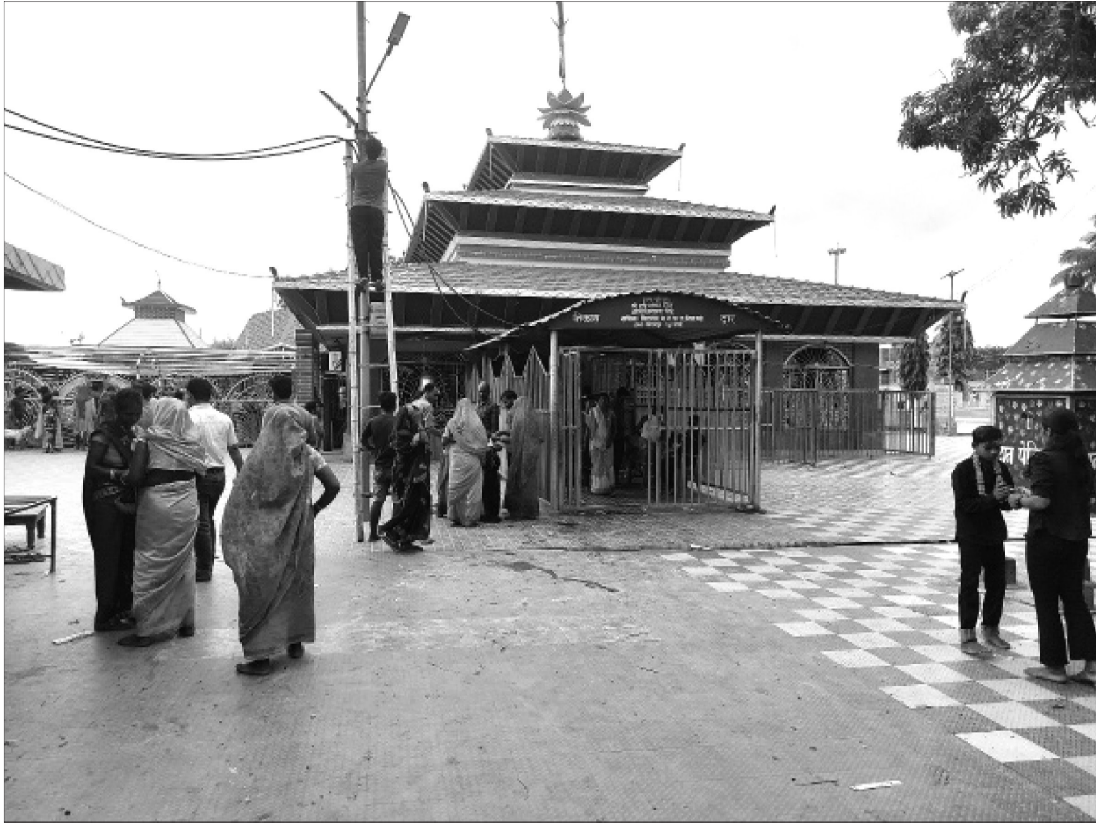
नवरात्रको दोस्रो दिन सप्तरीको छिन्नमस्ता गाउँपालिका ३ स्थित प्रसिद्ध छिन्नमस्ता भगवती मन्दिर सखडामा पूजाअर्चनाका लागि आएका दर्शनार्थी ।