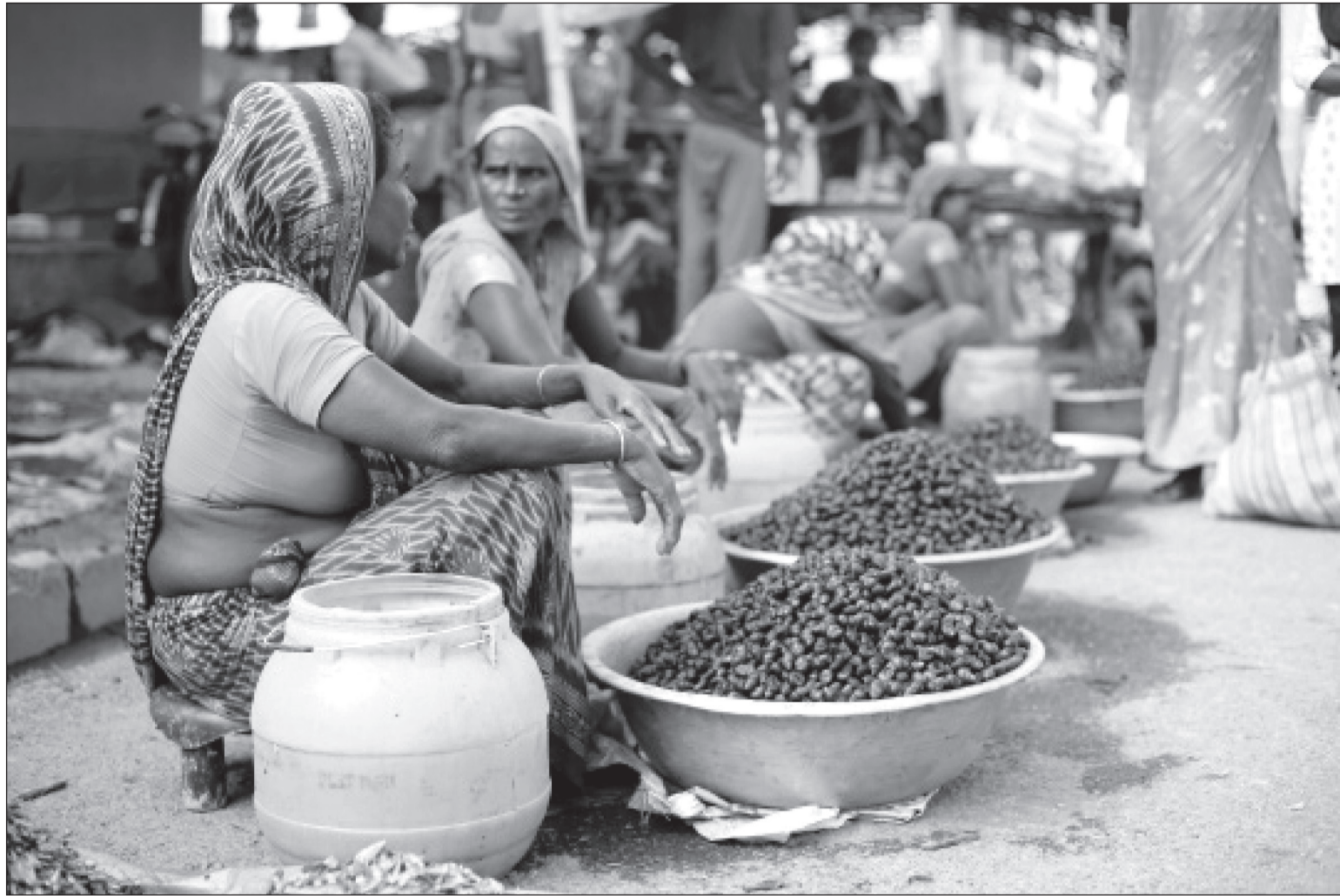
हटियामा बिक्रीका लागि राखिएको छुंगी। पौष्टिक तत्वले भरिपूर्ण छुंगी स्थानीय बजारमा प्रतिकूलो सय रुपैयाँमा बिक्री हुने व्यापारी बताउँछन्।