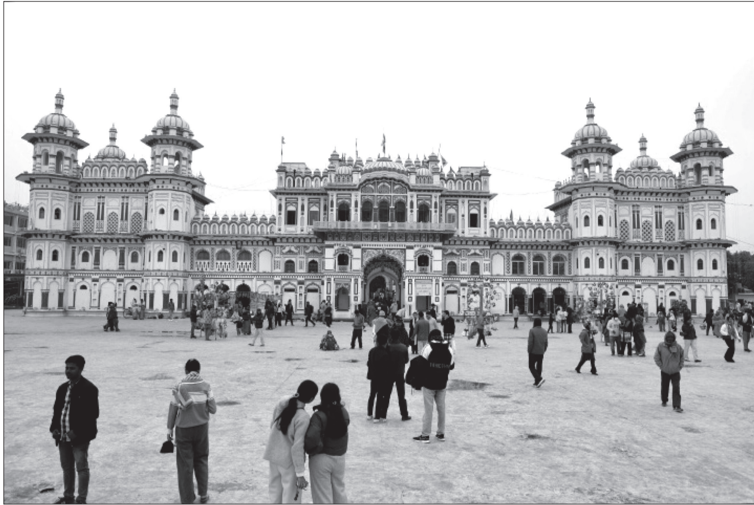
जनकपुरधामको जानकी मन्दिरको दर्शन गर्न आएका आन्तरिक तथा वाह्य पर्यटक। यहाँ भारतबाट वर्षेनी विवाह पञ्चमीको अवसर पारेर जन्तीका रुपमा तीर्थयात्रीहरू आउने गर्छन्।