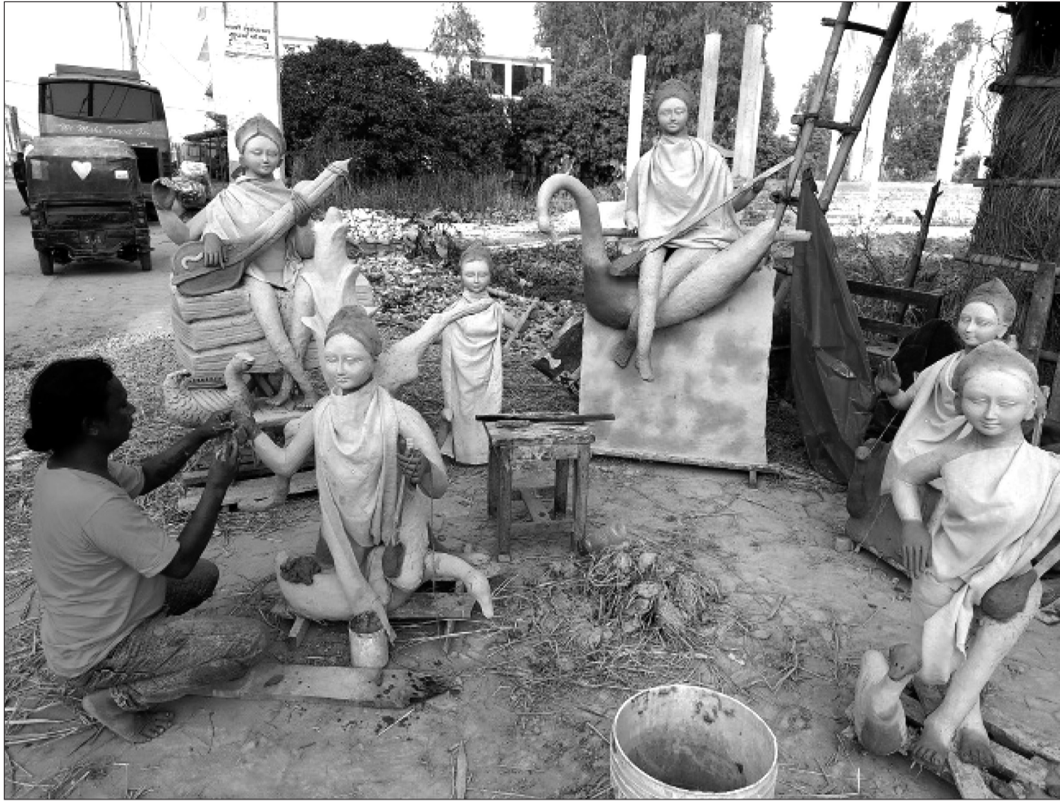
सरस्वती पूजा नाजिकैंदे गर्दा महोत्तरीको जलेश्वर नगरपालिका-१ मा सरस्वती माताको प्रतिमालाई अन्तिम रूप दिँदै कालिगड ।