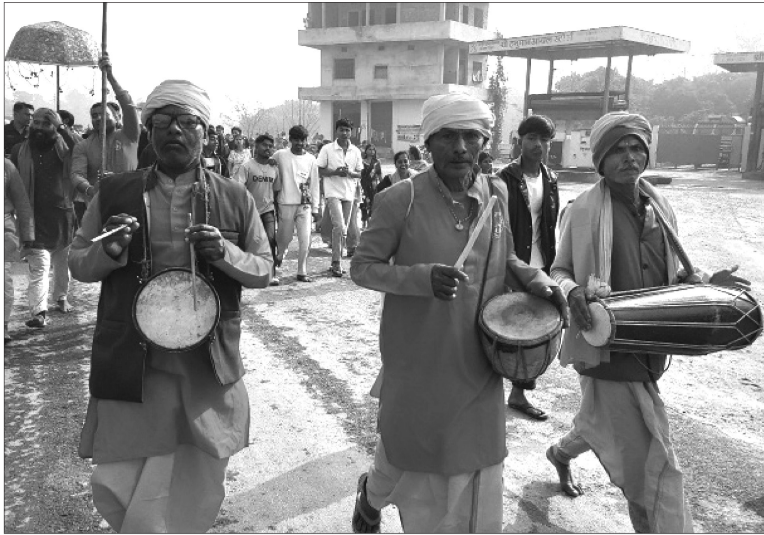
गजाबाजा सहित मिथिला विहारीको डोला मिथिला मध्यमा परिक्रमाका लागि प्रस्थान ।