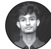
लेखक: शम्भु साह (कान्छी सल्लाहकार) ठेगाना: मिरचैया न. पा. १९

गाउँ-बेसी भुक्तिसक्यो, एउटा नयाँ आशा लिएर, हातमा भण्डा, मनमा सपना, रङ फेरिने भाषा लिएर। चोक-चोकमा गफ छन् ताता, को आउला? को जाला? के यो पटक साँच्चै नै, देशले नयाँ काँचुली फेला ?