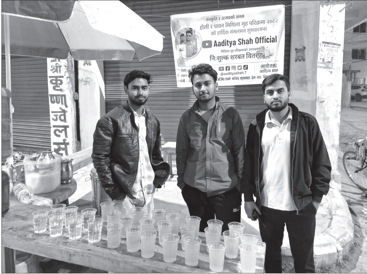
अन्तरगृह परिक्रमामा सामाजिक संजालबाट आर्जन गरेको रकमबाट युवाहरूको पहलमा श्रद्धालुभक्तजनहरूलाई निःशुल्क सरबत बाडिँदै ।