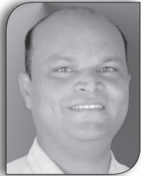
• राजेश विद्रोही

फागुन महिना लागेसँगै वैवाहिक लगनगठौटोको मौसम सुरु भएको छ । समाजले सहजै स्वीकार्ने अनेक प्रकारका विवाह यस अवधिमा देखिन्छ-स्वजातीय विवाह, अभिभावक र आफन्तको रोजाइमा हुने विवाह, दाइजो प्रथामा आधारित विवाह, यहाँसम्म कि बालविवाह पनि । यी सबै खालका विवाहलाई समाजले सामाजिक विवाहका रूपमा सामान्य रूपमा ग्रहण गरेको पाइन्छ तर अन्तरजातीय विवाह भने अझै पनि समाजको स्वीकृतिको दायराभित्र पर्न सकेको छैन । युवायुवतिले आपसी समझदारी, प्रेम र स्वतन्त्र निर्णयका आधारमा गर्ने यस्तो विवाहलाई समाजले सहज रूपमा स्वीकार गर्न सकेको देखिँदैन किनभने नेपाली समाजको सबैभन्दा गहिरो, जटिल र दीर्घकालीन संरचना जातीय व्यवस्था हो ।