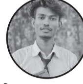
लेखक: शम्भु साह ठेगाना: मिरचैया न. पा. ११

हिँडा हिँड्दै थकाई लाग्छ, पाइलाहरू भारी हुन्छन् अँध्यारोले घेर्दा कहिले, मनमा धेरै पीर बन्छन्। तर नबिर्सनु यात्री तिमी, रातपछि बिहानी छ कालो बादल पन्छिएर, फेरि भुल्कने नानी छ। तगारो त आउँछु धेरै, बाटो छेक्न खोज्छु यहाँ दुबासँग जुध्न पाए, भरनाको स्वर खुल्छ जहाँ। पसिनाले सिँचेर हेर, मरुभूमिमा फूल फुल्छ मेहनतको चाबी भए, सफलताको ढोका खुल्छ। सानो एउटा दियो बाले, अन्धकार त भाग्छ नै अदम्य साहस बोकेर हिँडे, लक्ष्य आफैँ जाग्छ नै। धैर्य गर, प्रयत्न गर, मनमा अलिकति आस राख आफ्नै गन्तव्य भेट्नलाई, अधि बढ्ने प्यास राख।