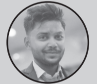
लेखक: बब्लु शर्मा ज. उ. न. पा. ७

घन्टी बज्यो गाउँभरि, खुशीले भरियो आँगन, जितको खबर ल्यायो, उज्यालो भयो जीवना मेहनतको मीठो फल, उज्यालो बन्यो बाटो, घन्टीको धुनसँगै, बलियो बन्यो साथ हो। जनताको विश्वासले, बढायो तिम्रो शान, घन्टीको मधुर आवाज, गुञ्ज्यो देशभरि गाना सपना आज साकार, खुल्यो सफलताको ढोका, जितको घन्टी बज्दा, हरायो मिराशाको सोका। बधाई छ तिम्रीलाई, जितको सुनौलो दिनलाई, घन्टी बजिरहोस् सधैं, खुशीका हरेक घडीलाई।