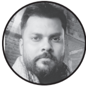
Md Ajad जनकपुर ८

सगरो सदरिखन छले छल भथायल अन्हरायल चकरन कतेक कहलिये कम नै समझौलिये तैयो मर्यादा के मर्दन क, सीमा नाधि पकैर गर्दैन त सब लागल आव विध्वंसै छैक तहन बजे सब मने मन चुपे चाप घने घन आव आशा के दिप तिलमैत हर घर गलि दौने दैन धीरे धीरे जने जन आव के रोकते धधकैत धाहि जुवायल छै अनहरिया भेल इजोर छईक छउरा सब के नै छै तोर आव के उ नई होइ नोरे नोर नई चिहकै कोनो ठोर !!