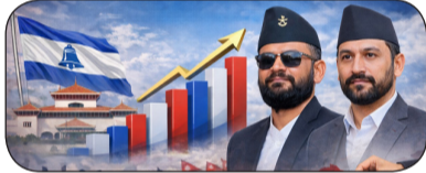
ल्याउँदा २ हजार ८४८ मतसहित राष्ट्रिय प्रजातन्त्र पार्टी (रास्वपा) तेस्रो स्थानमा छ।

टुडे समाचारदाता जनकपुरधाम। प्रतिनिधिसभाका लागि भएको निर्वाचनमा समानुपातिक तर्फको मतगणनामा पनि राष्ट्रिय स्वतन्त्र पार्टी (रास्वपा)ले सुर्वाती अग्रता लिएको छ। यो समाचार लेख्दासम्म शुक्रबार राति ९ बजेसम्म ३१ हजार ८८२ मत गणना हुँदा रास्वपाले १८ हजार ८३० मत पाएको छ। दोश्रोमा नेपाली कांग्रेसले ५ हजार ५६० त