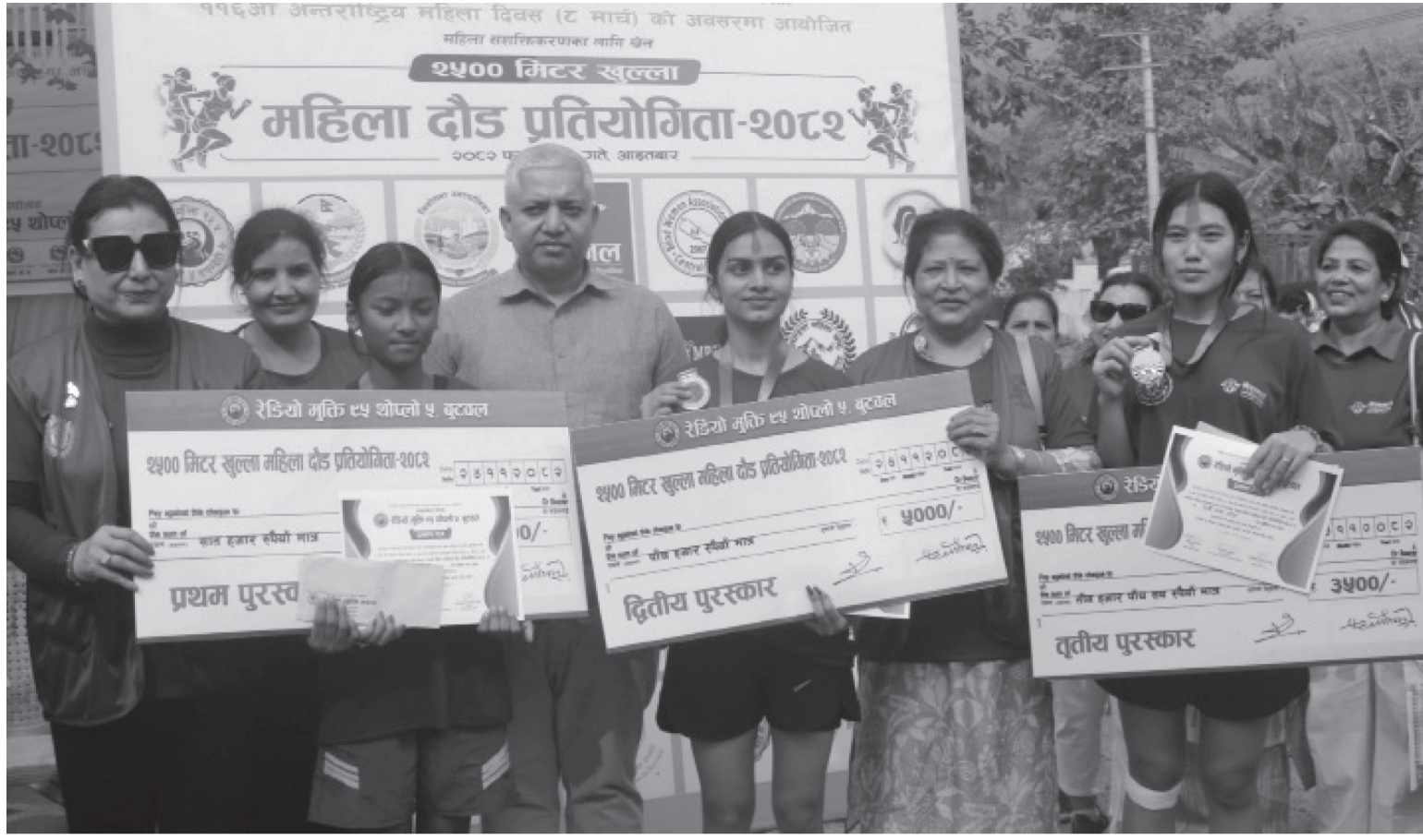
महिला समानताका लागि सञ्चार अभियानद्वारा सञ्चालित सामुदायिक रेडियो मुक्तिले ११६औँ अन्तर्राष्ट्रिय महिला दिवसको अवसरमा आइतबार बुटवलमा आयोजना गरेको महिला सशक्तिकरणका लागि २५ सय मिटर खुला महिला दौड प्रतियोगितामा प्रथम, द्वितीय र तृतीय हुनुभएका महिलाहरूलाई सम्बोधन गर्दै सञ्चार अभियानका कार्यकर्ताहरू।