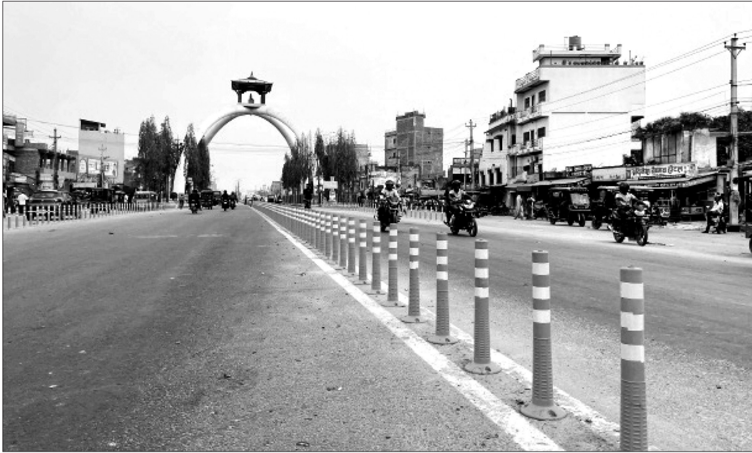
जनकपुरधामको रामानन्द चोकस्थित सडकमा धनुषा ट्राफिकले ट्राफिक व्यवस्थापन, दुर्घटना न्यूनीकरण तथा सडकको सौन्दर्यता वृद्धि गर्नको लागि लगाएको फ्लेजिङ्गल सिग्नाल पोष्ट।