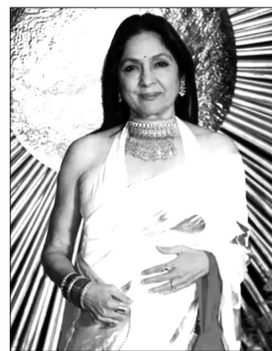
निस्किएको जस्तो लागेको हो ।' उनी आफू

बलिउड अभिनेत्री नीना गुप्ताको एक तस्वीर यतिबेला सामाजिक सञ्जालमा भाइरल भइरहेको छ । केही दिनअघि नवविवाहित जोडी विजय देवरकोन्डा र रश्मिका मन्दाणाको रिसेप्सन पार्टीमा उनी सेतो रंगको साडी लगाएर उपस्थित भएकी थिइन् । त्यसबेला उनको पेट गर्भवतीको जस्तो देखिएको थियो । यसपछि उनी आमा बन्न लागेको भन्दै व्यापक अफवाह फैलिएको छ । नानीले आफूलाई बधाईको ओइरो लाग्न थालेपछि यसबारे स्पष्टीकरण दिएकी छन् । उनले बलिउड हंगामासँगको कुराकानीमा आफू गर्भवती नभएको बताएकी छन् । उनले भनेकी छन्, 'म यही चाहन्छु कि एक रियल बधाई हो । 'बधाई हो' जस्तो कुनै सिन । तर, म गर्भवती छैन । खासमा मैले पार्टीमा लगाएको साडीको कपडा मोटो थियो, जसले गर्दा पेट