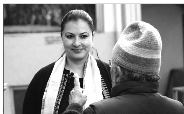
सबैभन्दा धेरै खर्च सामाजिक सञ्जाल (विज्ञापन र डिजाइन)मा भएको देखिन्छ । यसमा उनले साढे २ लाख रुपैयाँ खर्च गरेकी छन् । कार्यालय सञ्चालन, सवारी साधन, फोटो-भिडियो लगायतमा पनि