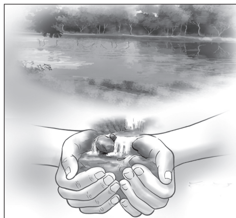
४० प्रतिशत जनसंख्या पानीको अभावबाट प्रभावित

वर्तमान समयमा जल संकट विश्वव्यापी रूपमा गम्भीर चुनौती बनेको छ। संयुक्त राष्ट्रका अनुसार करिब