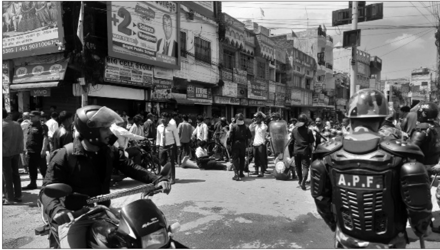
वीरगञ्जको हरिखेतान बहुमुखी क्याम्पसका शिक्षक, सञ्चालक समिति र कर्मचारीबीचको विवाद चर्किँदा सोमबार सो क्याम्पसमा अध्ययनरत विद्यार्थीहरूले वीरगञ्जमा विरोध प्रदर्शन गर्दै ।