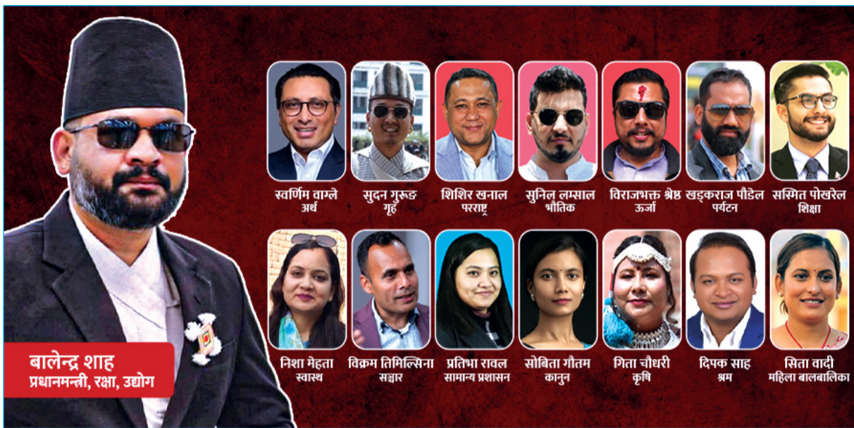
बालेन्द्र साह प्रधानमन्त्री, रक्षा, उद्योग