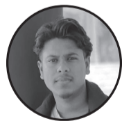
लेखक राजु ठाकुर हजाम

नव बिहानक उजास सन, आइल अछि नव नेतृत्वक प्रकाश। जन-जनक आशा संग लाए, बनाबै देशक नव इतिहास। माटिक गंध सँ जुड़ल मन, जनताक पीडा बुझय जो। सपना सभक साकार करय, साँच मार्ग पर बढ़य जो। न्याय, विकास आ शांति लेल, उठल अछि नव एक आवाज। हाथ पकडौ सबके संग लाए, आगू बढ़ाबय देशक लाज। हे नव प्रधानमंत्री, आशाक दीप जराउ सदियखन। जनताक विश्वास बनल रहू, देश फुलाउ अहाँक करन।