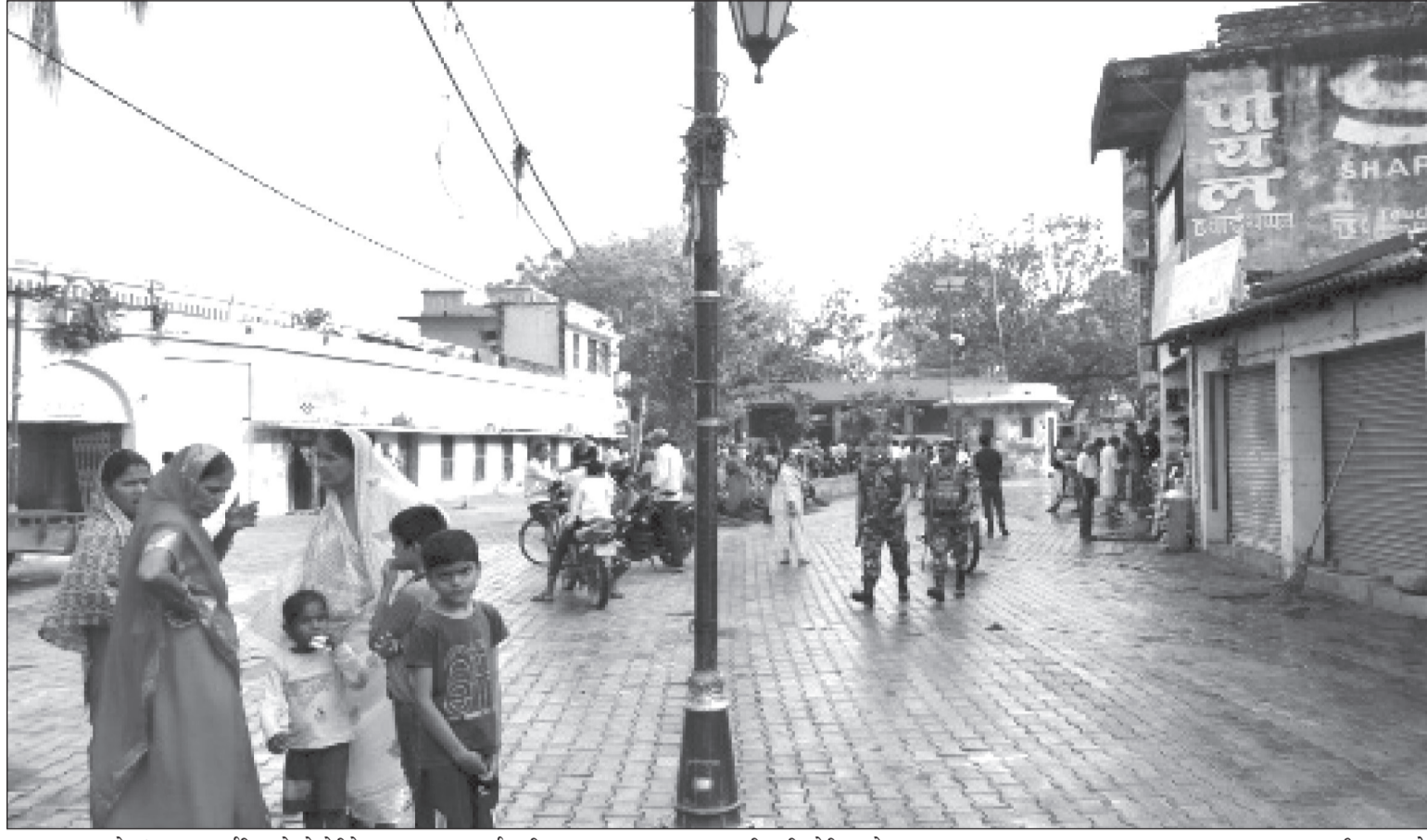
जनकपुरधामको गंगासागर पुर्वतिर रहेको हेरिटेज वाक साइटलाई अतिक्रमण मुक्त गराएर सफा गरिएपछि देखिएको सुन्दर दृश्य ।