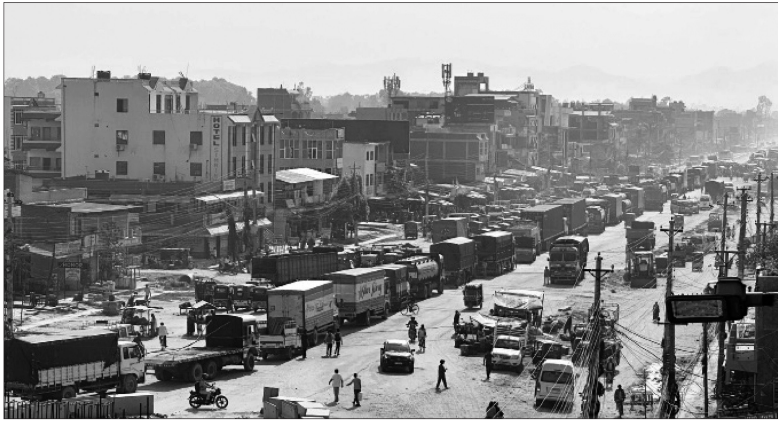
पूर्व-पश्चिम राजमार्ग अन्तर्गत सिरहाको लहानमा सडक विस्तारमा भएको ढिलासुस्ती र धुलोको विरोधमा स्थानीयवासीले शुक्रबार सडक अवरोध गरेपछि सडकमा रोखिएका सवारी साधन । कञ्चनपुर-कमला सडकखण्डको काम ६ वर्षसम्म पनि अलपत्र पारेपछि आजित भएका स्थानीयले निर्माण कम्पनीविरुद्ध प्रदर्शन गरेका हुन् ।