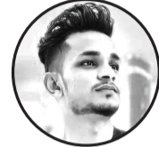
लेखक : मो.अमिर हुसैन ठेगाना : जनकपुरधाम ३५ लोहना

हिमालको काखमा चाँदीको दरबार, पहाडका पाखामा हरियो श्रृङ्गार। नदीको सुशोली, भरनाको भङ्गार, प्राकृतिक सुन्दरताको अनुपम भण्डार। यही माटोमा जन्मिए बुद्ध महान, शान्तिको सन्देश फैलाउँदै राखे देशको मान। वीर गोर्खालीको वीरताको इतिहास, दुश्मनलाई परास्त गर्ने अदम्य विश्वास। नेपाल सेना, देशको ढाल, हरेक विपत्तिमा खडा हुन्छ पर्खाल। विभिन्न भेषभूषा, सांस्कृतिक प्रदेश, नेपाल प्यारो, प्यारो हाम्रो देश।