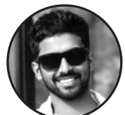
लेखक: उदय प्रसाद ठेगाना: खडक नगरपालिका (-३ सप्तरी)नेपाल

लेखक: दिलीप कुमार दास ठेगाना: धनुषाधाम - ०४ लक्ष्मीपुर “लामो छ यात्रा” छोटो छ जीवना लामो छ यात्रा सानो छ रहना दूलो छ सपना।। जीवन भो छा सुकैको रूख जसो। सपना भै आकाशमा तारा भै चम्कंदै छन् सफलताको आराम बित्दै छन् जीवन सपना पूरा गर्ने आस बढ्दै छन्। दुःख पीडाले भरिएको छ जीवना कोई छैनन् आफ्नो ॥ नदीको पानी जसो बढ्दैछ सपना। न रोकाय छ पानी । न रोकाय छ यात्रा।। संघर्ष अगाडि अझै बढ्दै छन्। सपनाको किनारा खोज्दै छन्। नयाँ छ सहर नयाँ छ ठाउँ। कोई छैनन् आफ्नो। आश दिने धेरै छन्। साथ दिने छैनन् कोई। सबै स्वार्थी छन् । कोई छैनन् आफ्नो। फूल जसो कोमल छ जीवना मौरी जसो छ यात्रा। न रोकिने ठाउँ छ। न बस्ने ठाउँ छन्। काँडा जसो भो छ यो जीवना। दुःख दुखैले भारी एको छ जीवना न सुख छान शान्ति छन्। जीवनको यात्रा जारी छन्।।