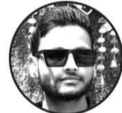
लेखक: बिनोद कुमार चौधरी ठेगाना: मिथिला न.पा.०३ हरिहरपुर धनुषा, नेपाल