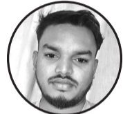
लेखक: दिलीप कुमार दास ठेगाना: धनुषाधाम - ०४ लक्ष्मीपुर

तिम्रो माया कति छ भनेर नसोध न सानू... यो त कुनै अंकले नापिने कुरा होइन, यो त आत्माको महसुस गर्ने गहिरो अनुभूति हो। तिमी मेरो जिन्दगीमा आएपछि सबै कुरा बदलिएको जस्तो लाग्छ, रङ्गहीन दिनहरूमा पनि इन्द्रेणी भल्किएको जस्तो लाग्छ। तिमी टाढा हुँदा मन किन यति खाली-खाली हुन्छ, जस्तो सास त चलि रहेको छ तर बाँच्नु भने अधुरो हुन्छ। तिम्रो मुस्कानमा मेरो संसार बस्छ सानू, तिम्रो एउटा सानो कुरा पनि मेरो दिनलाई उज्यालो बनाउँछ। आकाश जति फराकिलो भए पनि मेरो माया अझै फैलिएको छ, समुन्द्र जति गहिरो भए पनि मेरो भरोसा अझै डुबेको छ। तिमी रिसाउँदा मेरो मुटु नै डराउँछ, तिमी हाँस्दा भने मेरो संसार नै रमाउँछ। नसोध न सानू कति माया गर्छु भनेर, यो त हरेक घडकनमा तिमी बस्ने अनन्त कथा हो। यदि कहिल्यै थाहा पाउन मन लाग्यो भने मेरो आँखामा हेर न... त्यहाँ तिमी मात्र हुनेछौ, र त्यो मायाको अन्त्य कहिल्यै हुने छैन।