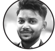
लेखक: बब्लु शर्मा ज. उ. नं. पा. ७

जीवन एउटा अमूल्य धन, यसलाई जोगाउनु हाम्रो कर्तव्य बना। सुख-दुःखले भरिएको बाटो, हिम्मतले पार गरौं हरेक घाँटो। सानो खुसीमा हाँसि सिक, दूलो पीडामा पनि नभुक्का। आशा बोकी अघि बढ्दै जाऊ, अँध्यारोपछि उज्यालो पाऊ। आमा-बुबाको माया अमूल्य, तिनको साथले जीवन पूर्णा। मित्रता, प्रेम, विश्वासको डोरी, यिनै हुन् जीवनका साँचो जोरी। समय कहिल्यै फर्केर आउँदैन, हरेक पललाई खेर नफाला। राम्रा कर्मले नाम बनाऊ, जीवनलाई सुन्दर बनाऊ। जीवन सानो तर अर्थ दूलो, यसलाई बनाऊ सुनजस्तै भल्किलो। सपना देख र पूरा गर, आफ्नो बाटो आफै रोज।