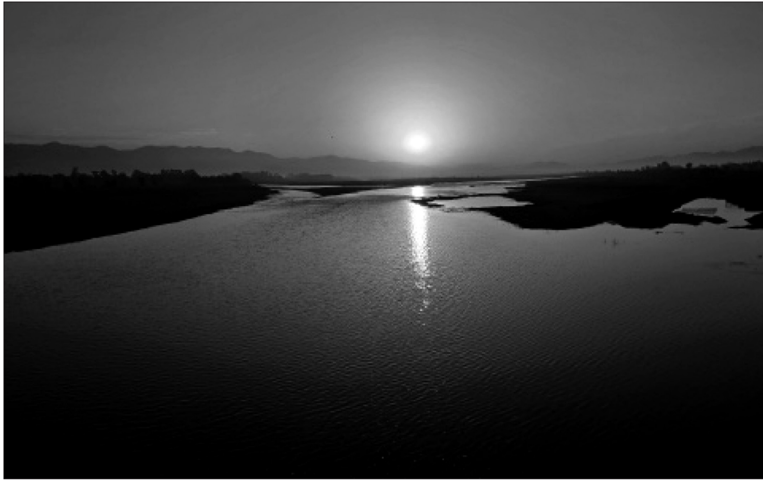
बिहान देखिएको सूर्योदय ।