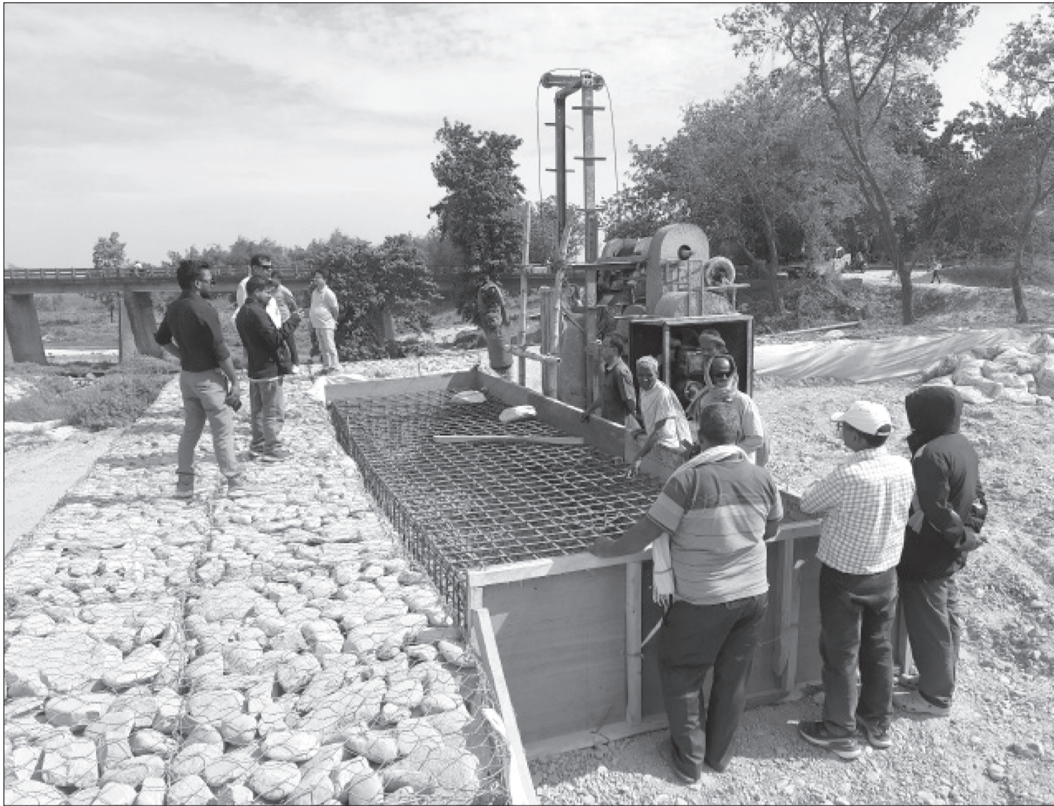
पर्सोको ग्रामीण भेगसँग जोड्ने वीरगञ्ज महानगरपालिका र बहुदरमाई नगरपालिकाको सिमानामा रहेको तिलावे पुल डेढ वर्षअघि क्षतिग्रस्त भएको स्थानभन्दा केही तल तिलावे नदीमा बेलाँचिज निर्माणधीन हुँदै। यो पुल समयमा नबन्दा सर्वसाधारणलाई आवतजावतमा गर्न समस्या भएको छ।