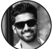
लेखक: उदय प्रसाद ठगाना: खडक नगरपालिका (-३ सप्तरी)नेपाल

छोटो छ जीवना लामो छ यात्रा। सानो छ रहना दूलो छ सपना। जीवन भो छ सुकेको रूख जसो। सपना भै आकाशमा तारा भै चम्कै छु सफलताको आशमा बितदै छु जीवन सपना पूरा गर्ने आस बढदै छु। दुःख पीडाले भरिएको छ जीवना कोई छैनन् आफ्नो ॥ नदीको पानी जसो बढैछन सपना। न रोकाय छ पानी। न रोकाय छ यात्रा। संघर्ष अगाडि अझै बढदै छु। सपनाको किनार खोज्दै छु। नयाँ छ सहर नयाँ छ ठाउँ। कोई छैनन् आफ्नो। आश दिने धेरै छु। साथ दिने छैनन् कोई। सबै स्वार्थी छु। कोई छैनन् आफ्नो। फूल जसो कोमल छ जीवना। मौरी जसो छ यात्रा। न रोकिये ठाउँ छ। न बस्ने ठाउँ छु। काँडा जसो भो छ। यो जीवना। दुःख दुखैले भारी एको छ जीवना। न सुख छान शान्ति छु। जीवनको यात्रा जारी छु।