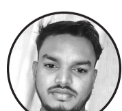
लेखक: दिलीप कुमार दास ठगाना: धनुषाधाम -०४ लक्ष्मीपुर

मेरो जिन्दगीमा यति धेरै पीडा छ, कसलाई भनूँ, कसले सुन्ने हो थाहा छैन। भीडको बीचमा पनि एक्लोपनले मलाई भित्रैभित्रै खाइरहेको छ। म एउटा फुटबल जस्तो भएछु, जता बाट पनि हानिन्छु, कसैले मेरो दुखाइ देख्दैन, सबैले आफ्नो खेल खेल्नहेका छन्। मेरो मन चिच्याउँछ, तर आवाज बाहिर आउँदैन, किनकि सुन्ने कोही छैन जस्तो लाग्छ। मलाई यति चिन्ताले घेरेको छ, सास फेर्न पनि गाह्रो भइरहेको छ। मनभित्र हजारौं आवाज छन्, तर बाहिर सबै मौन छ। मनमा एउटा चाहना छ- एक दिन सबैलाई छोडेर, टाढा कतै शान्त ठाउँमा बस्न, जहाँ कोही नहोस्, म र मेरो सास मात्र होस्। तर अहिले... म भाँचिएको छु, तर अझै जिउँदै छु- किनकि आशाको सानो फिल्लको अझै बाँकी छ।