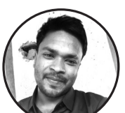
लेखक: अनिल कुमार मण्डल जनकपुर -३५

असफल भए भनेर। किन निरास हुन्छु म ॥ हिजो टेकेको पाइला पनि। भोलीको नयाँ बाटो देखाउछ नि। लड्डै उठडै हिडनु नै। जिवनको सत्य कथा हो हार होइन अन्तिम लक्ष्य सपना पूरा गर्ने हो असफलताले सिकायो मलाई धैर्य राखन र अधि बढन आन्धीपछी आउने घाम भै म बन्ने छु उज्यालो दिन एकादिन आउने छु आज रोकिए भए पनि भोलि फेरि उठने छु म सफलता नयाँ बाटो रचने छु म