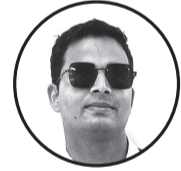
कलम : स्नेही साह हाल : खाडी मुलुकमा

यहाँ न कोइ किससे बात कर्ता हे यहाँ न कोइ किसका हाल परखता हे दर्द हो अगर कोइ सब चुपचाप सेहता हे ३ सेहेर खुबसुरत लगता हे ३ यहाँ रातमे भि भिड लगता हे यहाँ खाना भि समय से मिलता हे बस प्यासेको यहाँ पानी नहि मिलता हे कुतेको साही भोग लगता हे ३ सेहेर खुबसुरत लगता हे ३ सब अन्जान सब अजनबी स लगता हे पुछो किससे तो सब गाउँका लगता हे मिटिके बदनपे बस पैसा चमकता हे निन्द से आखे भरी हे ए साफ भलकता हे ३ सेहेर खुबसुरत लगता हे ३ मनमे छटपट मफिकमे आग लगा रेहता हे घर भि बनाना हे ए ख्याल चलता रेहता हे स्कुल गएहे बच्चे लोटके आए होडे ईश ख्याल से ओ शब्द मुसकुरता रेहता हे ३ सेहेर खुबसुरत लगता हे ३ अवाज इन्जिन कि भले परेशान कर्ता हे शौख कमानीकी एक उडान भरता हे लाख कोसिस के बाध भि हर शब्द थोरा गुमनाम रेहता हे ३ सेहेर खुबसुरत लगता हे ३