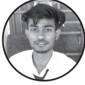
लेखक: शम्भु साह (कालुनी साल्लाहकार) ठेगाना: मिर्चैया न. पा ११

पहाडको टाकुराबाट उठ्दै, सुनौलो किरण फैलाउँदै, सबैलाई न्यानो दिँदै, घाम उदायो है। निद्राबाट बिउँझाउँदै, नयाँ दिनको थालनी, पन्छीहरूको गीत गाउँदै, यसले सबैलाई खुसी ल्यायो।