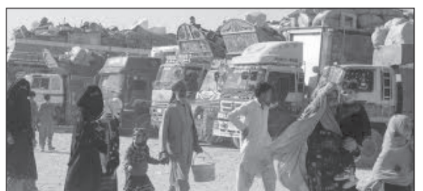
सुधारिएको एकीकरणको समर्थनले अफगानिस्तानको

रासस/एफपी । अफगानिस्तानको अर्थतन्त्र सन् २०२६ मा करीव चार प्रतिशतले वृद्धि हुने अनुमान गरिएको टोलो न्यूजले विश्व बैङ्कको एक विश्वाङ्कलाई उद्धृत गरी सोमबार जानकारी गराएको छ। बलियो घरेलु माग, बढ्दो निजी लगानी र श्रम बजारमा फर्कने आप्रवासीहरूको