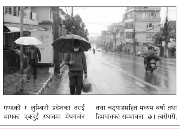
गण्डकी र लुम्बिनी प्रदेशका तराई भागका एकदुई स्थानमा मेघजन तथा चट्याङसहित मध्यम वर्षा तथा हिमपातको सम्भावना छ। त्यसैगरी,

र गण्डकी प्रदेशका केही स्थानमा मध्यम वर्षा भइरहेको छ। आज दिउँसो कोशी, बागमती र गण्डकी प्रदेशलागत देशका हिमाली तथा पहाडी भागमा आंशिक बदली रहने महाशाखाको पूर्वानुमान छ। कोशी प्रदेशका केही स्थानसहित बागमती र गण्डकी प्रदेशका हिमाली तथा पहाडी भागका केही स्थान, बाँकी हिमाली तथा पहाडी भागका एकदुई स्थान तथा मधेश, बागमती,