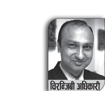
विभिन्न विभागका अधिकारी

नेपालमा हरेक वर्ष मे २ लाई राष्ट्रिय सूचना तथा सञ्चार प्रविधि दिवस (National ICT Day) का रूपमा मनाइन्छ। यस वर्ष 'सूचना प्रविधिको विस्तार: दिगो विकासको आधार' भन्ने मूल नाराका साथ देशभरि विभिन्न कार्यक्रमहरू आयोजना गरी यो दिवस भव्यताका साथ मनाइएको छ। सन् १९७१ (वि.सं. २०२८) को जगणनाका लागि नेपालमा पहिलोपटक 'IBM १४०१' कम्प्युटर भित्रिएको ऐतिहासिक दिनको स्मरण गर्दै यो दिवस मनाउने गरिन्छ। यस लेखमा नेपालको डिजिटल रूपान्तरण, उपलब्धि, चुनौती र आगामी मार्गचित्रबारे विस्तृत चर्चा गरिएको छ। १. ICT दिवसको ऐतिहासिक सन्दर्भ र सांस्कृतिकता नेपालमा प्रविधिको इतिहास धेरै पुरानो नभए पनि यसले छोटो समयमै ठूलो फड्को मारेको छ। मे महिनामा भएको क्यान महासंघ (CAN Federation)