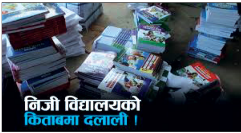
निजी विद्यालयको किताबमा दलाली ।