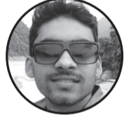
राज राय महट्ट मटिहानी नगरपालिका-०१, धिरापुर, महोत्तरी

भुट्टै भुट्टैबीचको सत्य मा भ्रम र रहस्यले भरिएको यो संसार, त्यसै संसारको एउटा सानो अंश मा भाइको लागि बल, समाजका लागि कलाकार, आफ्नै जीवनको लागि साधारण पात्र मा अनेकौं रूप, स्वरूप, चरित्र र स्वभावको यो संसार, त्यसै संसारको एउटा सानो अंश मा पिताका लागि उनकै सास, माताका लागि उनकै हृदय मा कर्तव्यपथ देखाउने यो संसार, त्यसै संसारको एउटा सानो अंश मा छोराका लागि रामसेतु मा, श्रीमतीका लागि उनकै श्रृंखार मा माया र सम्बन्धको जालो यो संसार, त्यसै संसारको एउटा सानो अंश मा राष्ट्रका लागि सेवक, ईश्वरका लागि अभिनेता, आवश्यकता परेको बखत कसैको आशा मा आफ्नो लागि म आफै बनेको संसार, त्यसै संसारको एउटा सानो अंश मा