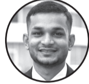
लेखक : मो. आशिर हुसैन ठेगाना : जनकपुरधाम ३५ लोहना

इतिहासको पाना पल्टाउँदा, बालविवाहको तीतो सत्य भेटाउँदा, जुन बेला समाज रुढीवादमा डुबेको, कलिला बालबालिकाको सपना टुटेको। दर्दनाक कथाले मन चिसिन्छ, नारीलाई वस्तु सम्भन्ने खराब चरित्र। स्वास्थ्यमा गम्भीर संकट, जोखिममा ज्यान, कलिलो उमेरमै गर्भवती हुँदाका दर्दनाक प्रमाणा विकासको टोका बन्द, भविष्य नै सुनसान, बाल अधिकारको खुलेआम हनन, मानवताको अपमान। अब मधेश प्रदेशको कुरा गरौं, जहाँ बालविवाहको जरा अझै गहिरो रहेछ। पर्सा, बारा, रौतहट, महोत्तरी, सर्लाहीमा यो प्रथाको प्रभाव बढी देखिन्छ। शिक्षाको कमी, गरिबी र दाइजो प्रथाले यहाँका छोरीहरूको जीवन जोखिममा पारेछ। मधेशका युवा अब उठ्नुपर्छ, समाजमा व्याप्त यो अन्यायविरुद्ध बोल्नुपर्छ। गाउँगाउँमा, टोलटोलमा सचेतनाका कार्यक्रम चलाउनुपर्छ, बालविवाह नगरौं भनी सबैलाई बुझाउनुपर्छ। विवाह भन्दा पहिला बालबालिकालाई राम्रो शिक्षा दिऔं, ज्ञानको ज्योतिले जीवनको हरेक पक्षलाई उज्यालाऔं। जबसम्म चेतनाको ज्योति घरघरमा पुग्दैन, बालविवाहको अन्त्य गर्ने हाम्रो सपना पूरा हुँदैन। बालअधिकारको रक्षा निमित्त हामी सबै एकजुट बनौं, बालविवाहमुक्त समाज, सुखी परिवारको नयाँ जग हालौं।