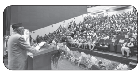
सुशासनको माध्यमबाट नै जनताको हित र चाहनासँगै संविधान र शासनप्रणालीले राखेको उद्देश्य पूरा हुन्छ । यस्तर्फ

सुनसरी । राष्ट्रपति रामचन्द्र पौडेलले मुलुक सङ्घीय लोकतान्त्रिक गणतन्त्रमा आइसकेपछि स्थानीय सरकारको महत्त्व र गरिमा व्यापक गहन भएको बताउनुभएको छ । सुनसरीको कोशी गाउँपालिकामा निर्माण भएको लोकही सिटी हल समुदायन समारोहलाई आज सम्बोधन गर्दै उहाँले जनताका न्यूनतम आधारभूत आवश्यकता, तथा जनचाहना अनुरूप विकासका कार्यलाई तिव्रता दिएर सङ्घीय लोकतान्त्रिक गणतन्त्रको मूल्य, मान्यता र आदर्श अनुरूपका कार्यहरू सकल बनाउनुपर्नेमा जोड दिनुभयो ।