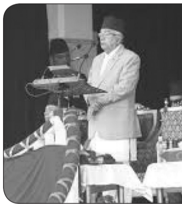
जनाउँदै राष्ट्रपतिले लोकतान्त्रिक गणतन्त्रको सुन्दर सपना बोकेका नागरिकलाई यीने वैधितिले निराश नबनाउने भनेतर्फ

गणतन्त्रको उच्चतम र सार्थक अभ्यासमा अगाडि बढ्न तथा राजनीति, राज्य र राजकाजलाई नैतिकता, निष्ठा र मूल्यमान्यताको सीमाभित्र आबद्ध गर्न आजका दिनले प्रेरणा दिने उहाँले विश्वास व्यक्त गर्नुभयो । मुलुकमा उत्पन्न विषम परिस्थितिपछि प्रतिनिधि सभा निर्वाचन सफलतापूर्वक सम्पन्न भएर बलियो जनादेशसहितको सरकार बनेको उल्लेख गर्दै राष्ट्रपति पौडेलले जनचाहनाअनुसार समृद्धिका लागि सुशासन, सार्वजनिक सेवा प्रवाहमा सुधार, आर्थिक पुनरुत्थान, भ्रष्टाचारविरुद्ध शून्य सहनशीलता र सामाजिक उन्नतिलाई आफ्नो आधारभूत मार्गदर्शनका रूपमा अगाडि बढाउने निर्णय गरेको बताउनुभयो । उहाँले शासकीय सुधारका एक सय कार्यसूचीलाई पूर्ण कार्यान्वयन गर्दै सीमारेखित अर्थतन्त्र, तोलरहित व्यापारको निमित्त संरचनागत र कानूनी सुधार गर्ने सरकारको निर्णय कार्यान्वयन भई जनतामा आशा जागृत हुने विश्वास व्यक्त गर्नुभयो ।