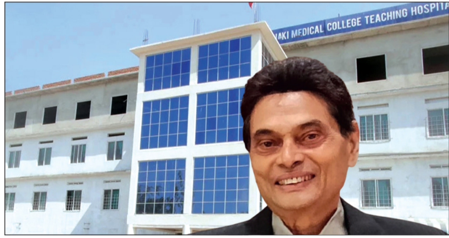
नगरपालिका-१ रामदैयास्थित जानकी मेडिकल कलेज