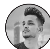
लेखक: मो. आमिर हुसेन

बुढापाकाको अनुभव र युवाको जोस यहाँ मिसाउनुपर्छ, हेरक घरबाट कम्तीमा एकजना यो अभियानमा जोडिनुपर्छ। जुन गाउँको युवा क्लब बलियो र संगठित हुन्छ, त्यो गाउँको शिर सधैं संसारको सामु उच्च रहन्छ। नबसौं कोही पनि पराई जस्तै रमिते बनेर, परिवर्तन आफैँ आउँदैन कसैको बाटो हेरेर। क्लबको बल नै गाउँको शक्ति हो, यो कुरा बुझौं, हाम्रो गाउँलाई स्वर्ग बनाउन आजैदेखि जुटौं। जब युवा क्लब अघि बढ्छ, गाउँको मुहार फेरिन्छ, अभाव र गरिबीको बादल बिस्तारै मेटिँदै जान्छ। पिउने पानी, बिजुली र शिक्षाको ज्योति घरघर पुग्छ, अनि मात्र देशको वास्तविक विकासको ढोका खुल्छ। यो अभियानमा जुट्ने मान्छे कहिल्यै पछि फर्दैन, नेतृत्व गर्ने क्षमता र आत्मविश्वास उसको कहिल्यै मर्दैन। बोल्ने कला, समाज बुझ्ने क्षमता र नयाँ सीप पाइन्छ, व्यक्ति आफैँ सक्षम नभई कहाँ समाज अगाडि बढाइन्छ र? गाउँ त अघि बढ्छ बढ्छ, जोडिने व्यक्तिको पनि प्रगति हुन्छ, सच्चा कर्म गर्ने मान्छेलाई यो समाजले सधैं पुग्छ। त्यसैले उठौं, जागौं र युवा क्लबलाई अझ बलियो बनाऊं, सद्भाव, एकता र विकासको नयाँ गीत मिलेर गाऊं।