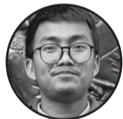
लेखक: पर्वत राज रत्नलाल (पर्साल धनुषा) ठेगाना : ग.चा. न.पा.१ (धनुषा)

भो अब नजन्माउ छोरी यदि छोरी भएर जन्मिनु अभिशाप हो भने भो अब तुहाइदेऊ बरु गर्भमे छोरी यदि छोरी भएर जन्मिनु पाप हो भने । महोदया जवान युवतीहरू त यहाँ निर्मम लुटिन्छन् लुटिन्छन् नरपशुहरूबाट विडम्बनाको कुरा, यहाँ त फकिने लागेको कोपिला पनि फुल नपाई निमोठिन्छ । जवान युवतीका पीडा त कति कति, महोदया यहाँ वृद्ध महिला पनि “जीवनको उत्तरार्धमा” आई मानवरुपी दानवहरूबाट निष्ठुर रूपमा लुटिन्छन् । जवान युवतीका पीडा त कति कति, महोदया कैयौं त यहाँ सहयोग पाउने आशमा बोल्दाबोल्दै जिउँदै लुटिन्छन् । भो अब तुहाइदेऊ बरु गर्भमे छोरी जन्म लिनु अभिशाप हो भने भएर छोरी भो अब नजन्माउ छोरी यदि वर्षेपिच्छे बलात्कारको सिकार भई बाँचिरहनु पर्छ भने छोरी ।