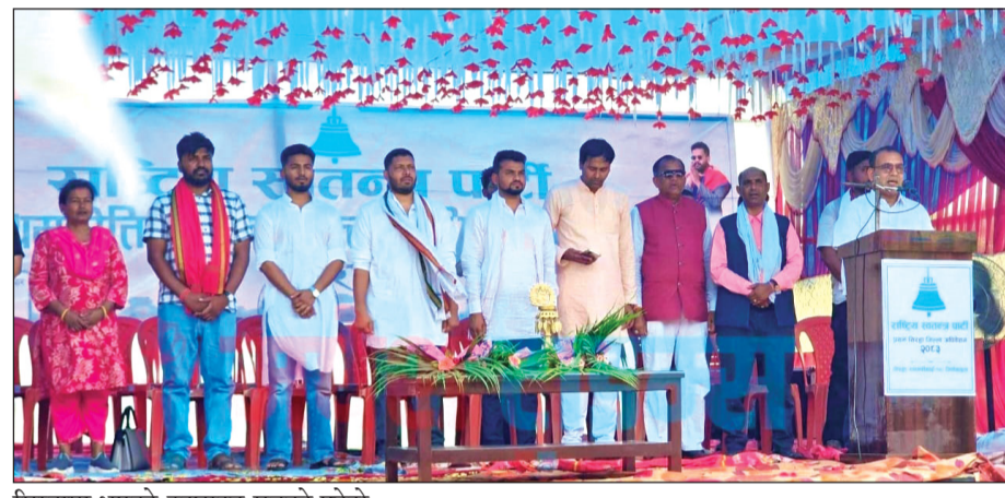
सिरहामा भएको उद्घाटन सत्रको फोटो