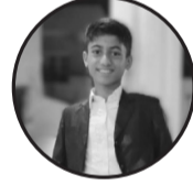
लेखक: प्रिन्स कर्की ठेगाना: नयाँ टिमी, महरपुर

नाझो जनता, नाझै नै छ देश नाझै छिन् विद्यार्थी, नाझै छ जेल, लुगा लगाएको छ गणतन्त्र। खाली नै छ कसुडी, खाली नै छ ढुकुटी, तर भरी छ संसद भरी छ गरिबी। अनि भरी नै छ गणतन्त्र। च्यातिएको इष्टकोट, च्यातिएको चोली, च्यातिएको अर्थतन्त्र, तर सिँहिएको छ गणतन्त्र। फोहोर छ जनताले पिउने जल, फोहोर नै छ पाँच वर्षमा धनी हिँडे गाउँ। तर सफा नै छ गणतन्त्र। खाली नै होस कसुडी, नाझै नै होस् विद्यार्थी, च्यातिएको नै होस् वस्त्र, फोहोर नै होस् गाउँ तर, केही नहोस देशको तन्त्र ॥