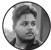
लेखक :- मुकेश कुमार यादव ठेगाना :- सबैला ११ इन्वर्वा

मेरो जिवनमा कोइ आयो। बारम्बार मिलन हुन थाल्यो। उसले भन्यो तिम्रो मन त मेरो जस्ते कुरा, भावना, सोचाइ कस्तो उस्तै उस्तै। जसरी कुवामा हेर्दा देखिन्छ आफ्नो आकृती उस्तै। उ जस्तो त थिएन तर भएको थिए उस्तै उस्तै। यति नजिक भयौं जसरी नरिवल र त्यस भित्र पानी। दुई शरीर भएपनी एउटै हो जस्तो लाग्यो हामी। नरिवल भित्रको पानी पनि निस्कियो रहेछ। जति मजबुत सम्बन्ध पनि टोडियो रहेछ। म त कुवा भएछु, मैले उसको जस्तै आकृती देखाउने रहेछु। म त पानी भएछु। किन यति नजिक छौ भनेको त, उसको प्यास बुझाउने रहेछु।