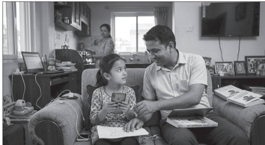
Ai generated image

विद्यालय मात्रै पाठ्यपुस्तक पढ्ने स्थान होइन, व्यक्तित्व निर्माण गर्ने संस्था पनि हो । शिक्षकको व्यवहारले बालबालिकाको आत्मविश्वास र सिकाइ प्रक्रियामा गहिरो प्रभाव पार्छ ।