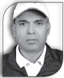
● श्रीमान नारायण

दक्षिणी छिमेकी भारत विश्वको उदाउँदो शक्ति राष्ट्र हो । शिक्षा, स्वास्थ्य, यातायात, विज्ञान, सूचना प्रौद्योगिकी, आर्टिफिसियल इन्टेलिजेन्स (एआई) र अन्तरिक्ष अनुसन्धानको क्षेत्रमा यसको निरन्तरको प्रगति विश्वमै चर्चाको विषय बनेको छ । कोभीड-१९ को समयमा यसले दक्षिण एशिया सहित विश्वका कतिपय देशहरुलाई उपलब्ध गराएको र अनुदान दिएको जीवनरक्षक औषधि स्वास्थ्य उपकरण र कोभीड विरोधी भ्याक्सिनहरुले विश्वका लाखौं-करोडौं व्यक्तिको ज्यान जोगाउने काम गर्‍यो । भारतको स्वास्थ्य उपचारलाई दक्षिण एशियाकै सर्वोत्कृष्ट र एशियाको उच्च कोटी मानिन्छ । दक्षिण एशियाका देशहरुसहित, एशिया, र अफ्रिकाका अनेकौं नागरिकहरु जटिल रोगहरुको स्तरीय उपचारको निमित्त भारतको एम्स जस्ता अस्पतालहरुमा उपचार गराउन आउँछन् र निको भएर जान्छन् । सस्तो भरपर्दो र सटिक उपचारको निमित्त भारतका शहरहरुमा उपचार गराउन आउने विदेशीहरुको घुइँचो लागेको हेर्न सकिन्छ । नेपालका नागरिकहरुको निमित्त भारतका अस्पताल र शहरहरु सधैं नै अपनत्वको अनुभूति गराउँछ । भारतको स्वास्थ्य एवं परिवार कल्याण मन्त्रालयद्वारा गत साता राष्ट्रिय स्वास्थ्य सर्वेक्षण-६ जारी गरियो । यस सर्वेक्षणको सञ्चालन स्वास्थ्य एवं परिवार कल्याण मन्त्रालयद्वारा सन् २०२३-२४ को अवधिमा मुम्बईस्थित अन्तर्राष्ट्रिय जनसंख्या विज्ञान संस्थान (आईआईपीएस) को सहयोगबाट नोडल एजेन्सीको रूपमा गरिएको थियो । ७१५ जिल्लाका फण्डे ६.७९ लाख परिवारहरुलाई समेटिएर गरिएको यो सर्वेक्षण जनसंख्या, स्वास्थ्य, पोषण र परिवार कल्याण सूचकहरुबारे महत्वपूर्ण प्रमाण उपलब्ध गराउँछ र जिल्लास्तर सम्म प्रमाण-आधारित योजना र कार्यक्रम कार्यान्वयनमा सहयोग गर्दछ ।