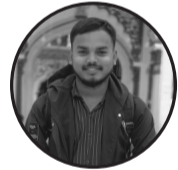
लेखक : दिलीप कुमार दास टेगाना: धनुषाधाम -०४ लक्ष्मीपुर

बिहानीको पहिलो किरणसँगै उठ्छ किसान, आशाको भारी बोकी पुछ आफ्नो खेतबारीमा। पसिनाले सिञ्चेको माटोले सुन फलाउँछ, तर उसको आफ्नै घरमा भोकको धुवाँ बल्छ। धामले पोल्छ, वर्षाले बगाउँछ, कहिले अंसिना, कहिले खडेरीले सताउँछ। जीवनभर माटोसँग लडिरहने यो योद्धा, आफ्नै दुःख कसैलाई सुनाउन पनि डराउँछ। ऋणको भारी काँधमा बोकेर हिँड्छ, बैंकको किस्ता सम्भेर रातभर जाग्छ। उसले उब्जाएको अन्नले देश पालिन्छ, तर उसकै चुलोमा कहिलेकाहीँ आगो बाल्न गाह्रो पर्छ। बजारमा पसिनाको मूल्य घटाइन्छ, बिचौलियाले उसको सपना लुटाइन्छ। मेहनतको मोल खोज्दै थाकेको किसान, आँसु लुकाएर फेरि नयाँ बिहानी कुछ। हे समाज, किसानको पीडा बुझिदेऊ, उसको श्रमलाई उचित सम्मान दिऊ। किनाफि किसान हाँसदा मात्र खेत हाँस्छ, खेत हाँसदा मात्र देश समृद्ध बन्छ।