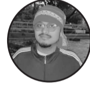
रचनाकार : सन्दिप कुमार महतो टेगाना : बर्दिबस न पा १९ बिजलपुरा हाल : गौशाला न पा १ रामनगर

तोहर एगो स्पलेन्डरके लागि कोइ दिन राइत पसिना बहबै है। सुनै छियै कोइ दहेज लेबे नै करै है मुद्दा दहेज किया दिय परै है। लेकिन वहि दहेज के लेल कोइ दिन राइत पसिना बहबै है।। भिख मे मिलल सोना पर घर के नया जमाइ अग्राइ है। पुतौह नै बेटि है हमर कहिक एहन ब्यहवार किया करै है। सुनै छियै कोइ दहेज लेबे नै करै है मुद्दा दहेज किया दिय परै है। हम्रो बियाह करके है बहिनके कोइ त बताउ कते खर्चा लगे है। कि अप्पन जिवन,कि अप्पन जमिर कि जमिन बनहकी लगाव परै है। लेकिन वहि दहेज के लेल कोइ दिन राइत पसिना बहबै है।। सुनै छियै कोइ दहेज लेबे नै करै है मुद्दा दहेज किया दिय परै है। लेकिन वहि दहेज के लेल कोइ दिन राइत पसिना बहबै है।।