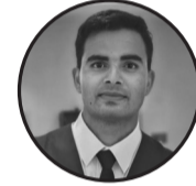
नाम सिनेही साह

निको हुँदै छ तिमिले दिएको घाउ बिन्ती मेरो यही छ तिमि फेरि मेरो नजिक नआउ देखियो संसार तिमि. अब कतै अन्तै जाउ ३ निको हुदै छ तिमिले दिएको घाउ ३ के के न हरायो के के न छिन्यो केवल तिम्रो मायामा म अनन्तै खुशी त थिए तिम्रो पछ्यौरिको छायामा तर तिमिले षड्यन्त्र रच्यो अरुको कायामा बडो मुस्किलले पाएछु म आफ्नो गुमाएका नाउ ३निको हुदै छ तिमिले दिएको घाउ बिन्ती यहि छ अब तिमि फर्केर न आउ ३ म पनि भुल्ने छु तर तिमि जतिको त हैन शायद अरुको नाम तिमि लिए थियो म हैन शायद रहने छ कर्म तिम्रो मेरो मनको आडनमा म रोए तिमि हास्यौ ठिक छ अबदेखि उ लाई नै हसाउ बिन्ती यही छ तिमि फेरि फर्केर नआउ ३निको हुदै छ तिमिले दिएको घाउ ३ स्मरण रहने छ तिम्रो त्यो एक भुटो बानी जहाँ तिमि भन्थेउ मलाई एकचोटी हसाएर जाउ खाली रहने छ मेरो मनमा तिम्रा लागि त्यो ठाउँ बिन्ती छ तिमि फेरि फर्केर म तिर फेरि नआउ ३ निको हुदै छ तिमिले दिएको त्यो घाउ ३