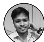
लेखक : - अनिल कुमार मण्डल जनकपुरधाम -३५

म त धेरै घुमे, हिमाल, पहाड, तराई। चिहाएँ,देखें प्रकृतिको गहिरो। म त धेरै घुमे, गाउँ र सहर डुलौं नयाँ साथी भेटें, जीवनका पाठ सिक्नौं। म त धेरै घुमे,मन्दिर, गुम्बा र चौतारी। सबै धर्म र संस्कृतिमा, देखें प्रेमको उज्यारी। म त धेरै घुमे, पूर्वदेखि पश्चिमसम्म। नेपाल आमाको सुन्दरतामा, हराएँ मनको हरक्षण। म त धेरै घुमे, तर एउटा सत्य पाएँ आफ्नो देशभन्दा प्यारो, कतै पनि नपाएँ।