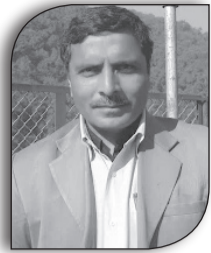
● प्रेमचन्द्र भा